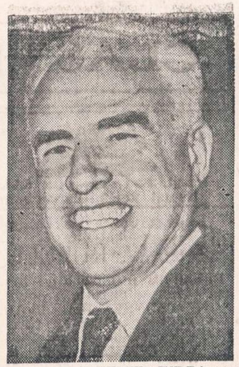
NAUJIENŲ AKMĖ Telepono Edward R. Stettinius, buvęs valstybės sekretorius, užvakar mirė nuo širdies priepuolio.

Tėsdamas toliau savo mintis, straipsnio autorius nieko nepasakoja apie lietuvių tautos galvojimą. Jeigu žinotume, kaip lietuvių tauta galvoja ir ką tokio ji yra sugalvojusi, o nepavyko kitoms tautoms, tai gal lengviau būtų išlaikyti ir ugdyti lietuviybę. Juo la-