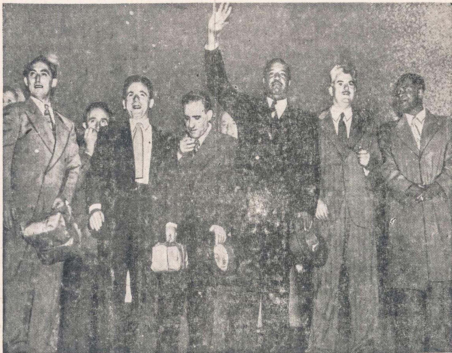
Komunistai padėjo 260,000 dolerių užstatą, kad galėtų išeiti iš kalėjimo, kol apeliacijos teismas peržiūrės jų bylą. Paveiksle matome kai kuriuos kompartijos narius, einančius iš New Yorko kalėjimo.