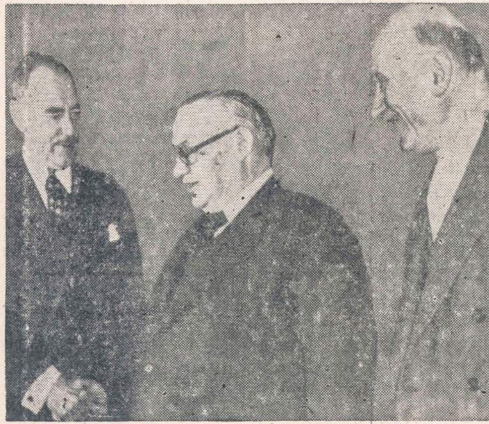
Paveiksle matome (iš kairės į dešinę) sekretorių Dean Acheson, britų užsienio ministrį Ernest Bevin ir prancūzų ministrį Robert Schuman. Trys ministeriai, padėjęjų patariamai, svarstė Vokietiją liečiančius klausimus.