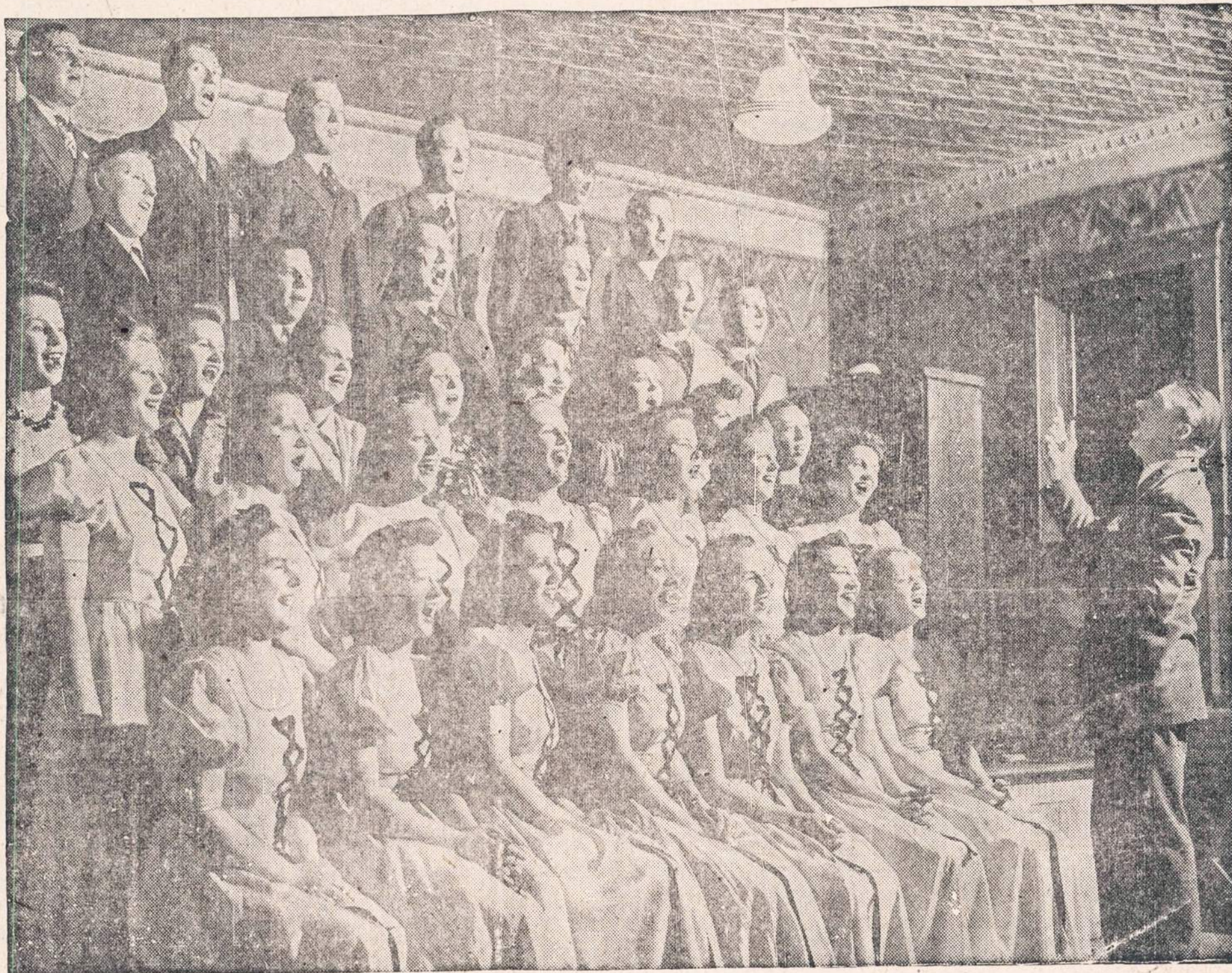
"PIRMYN" CHORAS DALYVAUJA DRAMOJE "IŠ MEILĖS"