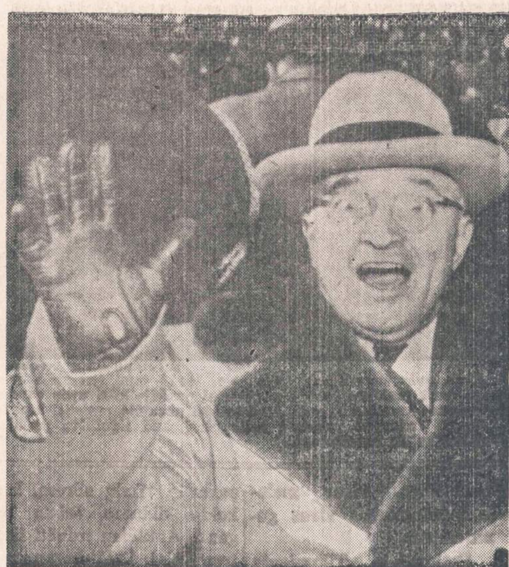
Philadelphijoje prez. Trumanas seka kariuomenės ir laivyno futbolo rungtynes.

—Karo specialistai kelis mėnesius ruošė strateginius planus Vakarų Europai ginti, o štabų viršininkai minėtus planus priėmė trijų valandų laikotarpyje.