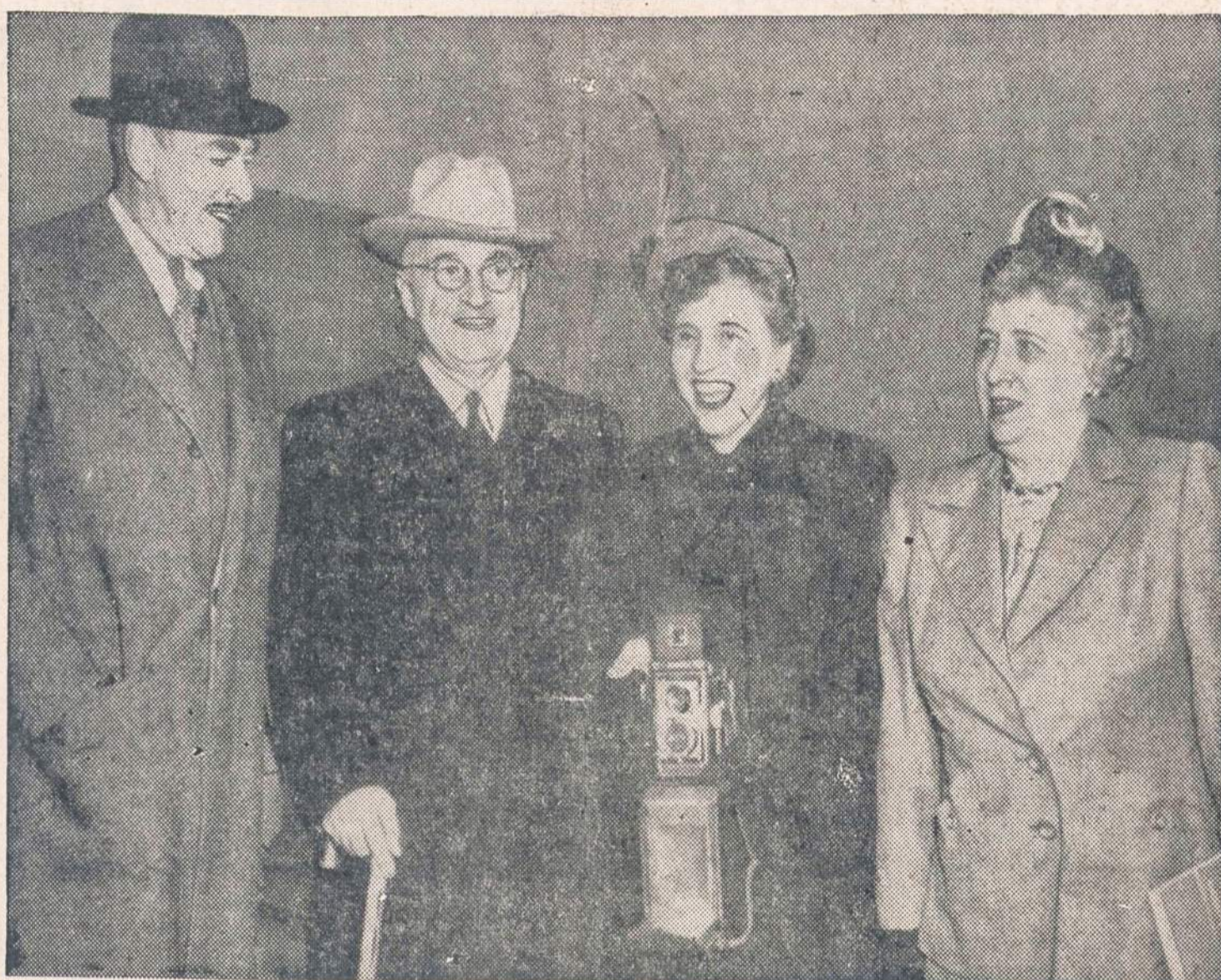
Sekretorius Dean Acheson atsisveikina prezidentą Trumaną, ponį prezidentienę ir jų duktę Margaritą, kai prezidentas išvyksta į Floridą. Prezidentas nutarė tris savaites pasilsėti. Key West jis išsivežė visą eilę svarbių dokumentų, kuriuos rengiasi studijuoti.