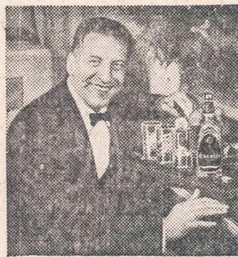
EZIO PINZA džiugiai "South Pacific" žvaigždė, sako: "Schenley yra ideali švenčių dovana. Tai mano pasirinkimas".