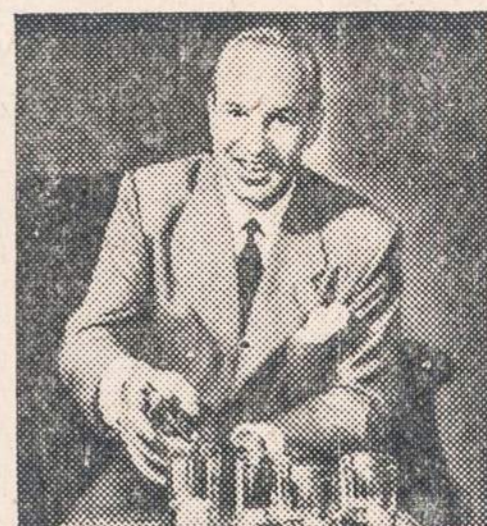
LLOYD NOLAN, pasižymėjusi ekrano žvaigždė, sako: "Schenley yra mano favoritas švenčių pasilinksminimui".