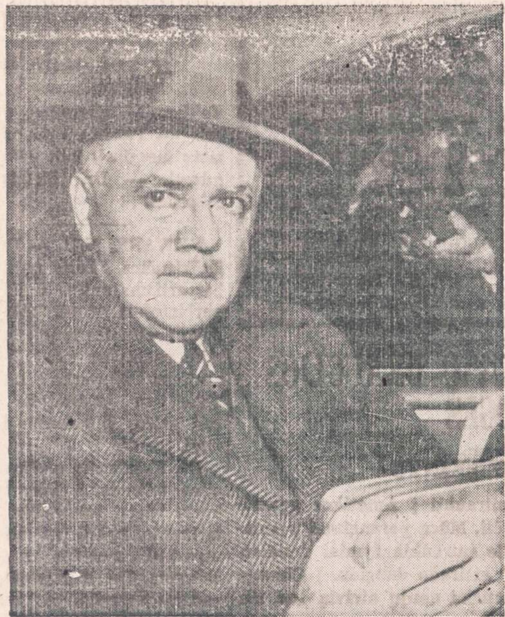
J. Parnell Thomas, buvęs kongreso atstovas, išeina iš teismo salės. Jis turės kalėti nuo 6 iki 18 mėnesių ir sumokėti 10,000 dolerių. Teisme paaiškėjo, kad jis imdavo dalį tarnautojų algos.

Skaitykite ir kitus paraginkite skaityti "NAUJIENAS"