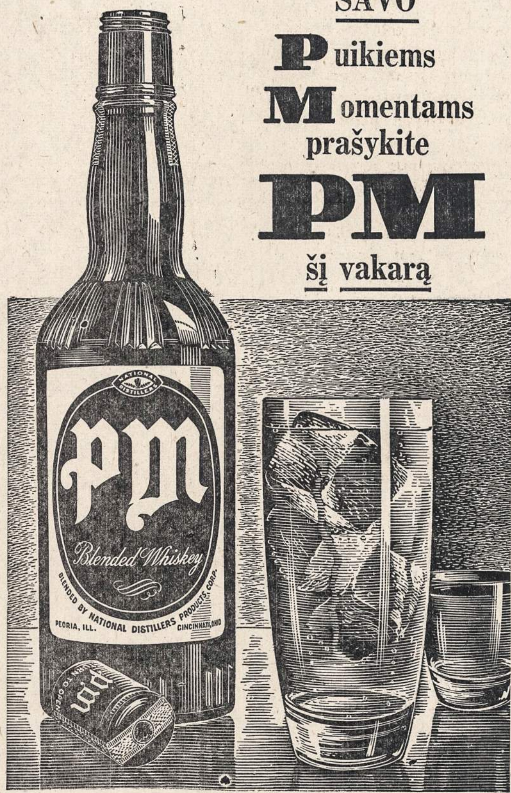
NATIONAL DISTILLERS PRODUCTS COOP., N. Y., N. Y. BLENDED WHISKEY. 66 PROOF. 65% GRAIN NEUTRAL SPIRITS.

Puikiems Momentams prašykite P.M. šį vakarą