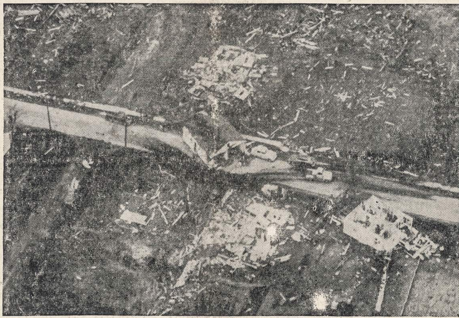
JUDSONIA, Arkansas. — Viesulas nubloškė namą į kelio vidurį.

Amerikos delegacijai vadovauja gen. Lauris Norstad, sąjungininkų oro jėgų vadas Viktorinėj Europoj (jo būstinė yra Vakarų Vokietijoj).