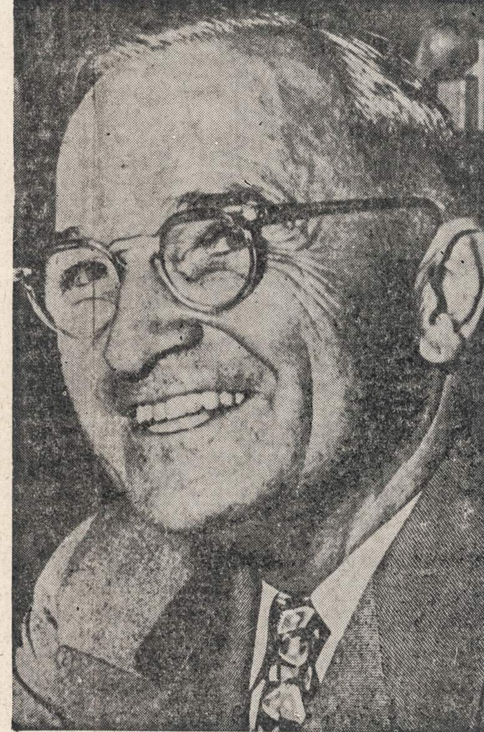
PREZIDENTAS TRUMANAS, pasakęs šeštadienį svarbią programinę kalbą Jeffersono-Jacksono Dieną Washingtone ir pranešęs, kad jis nebekandidatuos į prezidentus.