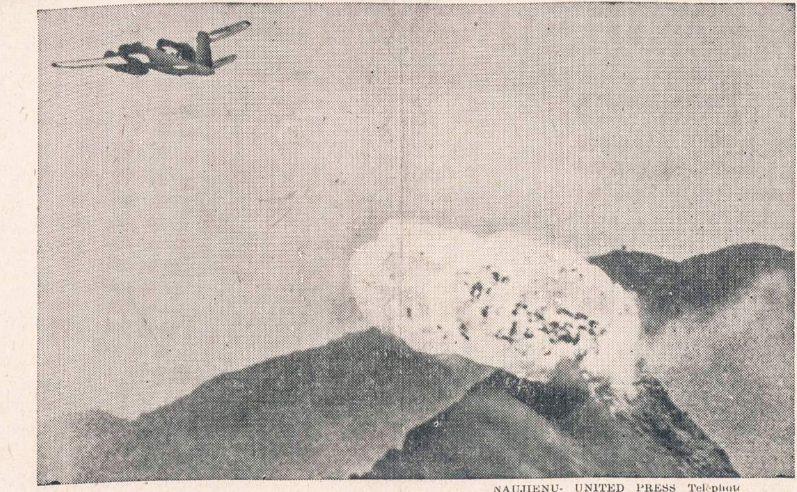
Didžiausia oro ataka Korėjos kare. Amerikos bombonešiai ir įvairios rūšies lėktuvai beveik visiškai sunaikino penkis Šiaurės Korėjos elektros jėgaines prie Mandžūrijos sienos. Iš priešų pusės beveik nebuvo jokio pasipriešinimo.

PERU, Indiana. — Pabėgęs iš Cole Brothers cirko narvo liu- tas kelias valandas terorizavo miesto 12,000 gyventojų, kol galiausiai buvo policijos ir cirko sargų užtiktas ir įvarytas į at- gabentą narvą.