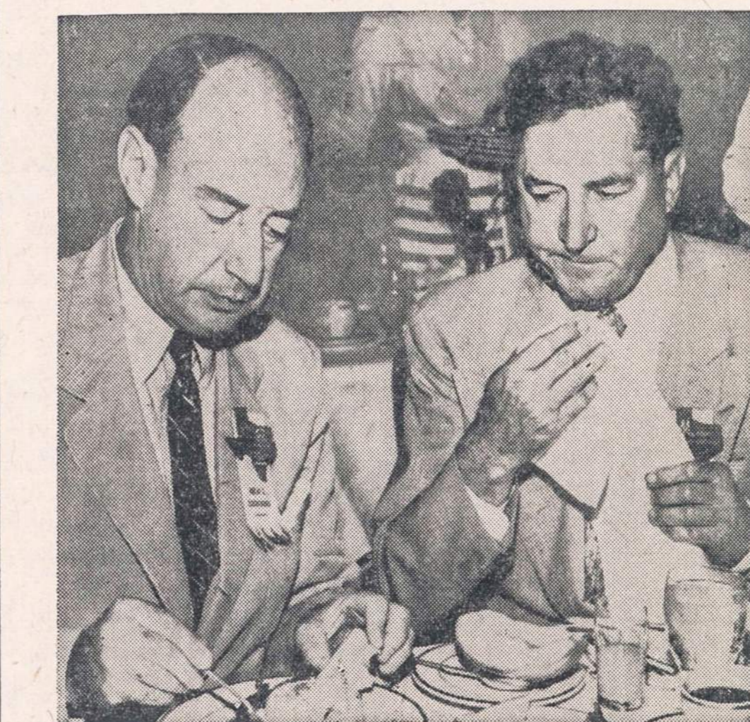
Illinois valstybės gubernatorius Adlai Stevenson (kairėje) kalbasi su Ohio gubernatoriumi Frank Lausche. Susitiko jie Houston mieste, Texas. Sakoma, kad Stevenson pareiškė, jog jis sutiks kandidatuoti į prezidentus, jei demokratų konvencija užsirsiantį jį nominuoti.