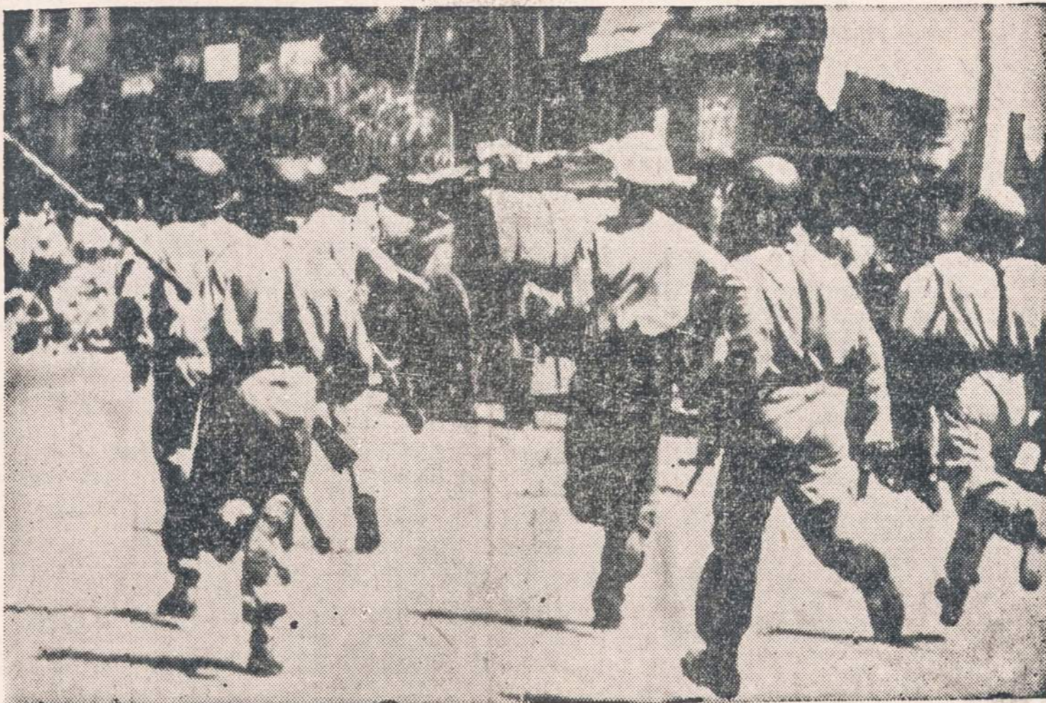
Irano sostinėje, Teherane, policija puola riaušinėlius. Riaušės kilo ryšium su premjero Mossadegh rezignavimu.

UP rašo, kad Gromyko bus atsivežęs ir Stalino valios pareiškimą, sušaukti nedelsiant keturių didžiųjų konferenciją.