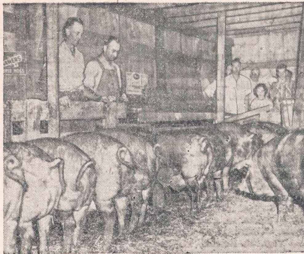
Spring Grove, Minn.—Kiauliu "šeima" iš 18 narių (šešių mėnesių amžiaus) sveria 4,992 svarus. Beveik nuo gimimo dienos parsiukai buvo maitinami sintetiniu pienu.

Brinka, parašęs pirmąją dalytį savo atsiminimų, pasiuntė "Gaidžio Skiauterės" redakci-