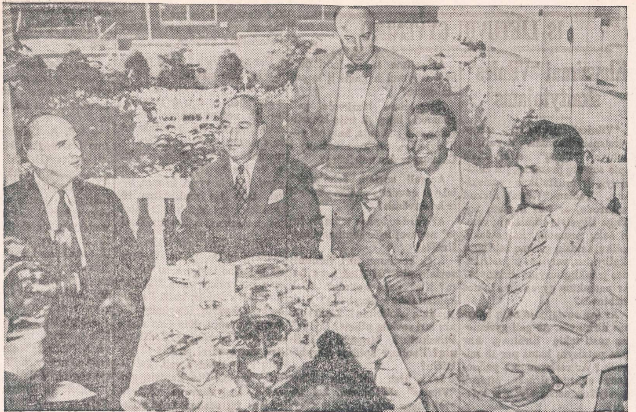
Šis kairės į dešinę: senatorius Richard M. Russell; Illinois gubernatorius Adlai Stevenson ir politinės kampanijos manadžeris Wilson W. Wyatt; (stovi) Averill Harriman ir senatorius Blair Moody. Jie visi susirinko gub. Stevnsono būstinėje Springfielde aptarti rinkimines kampanijos reikalus.