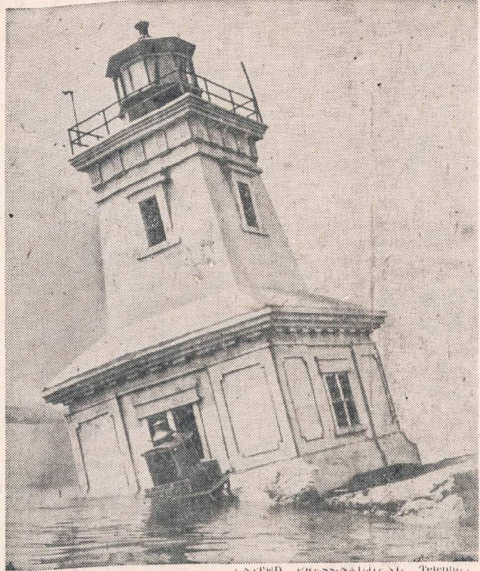
LAIVAS NULENKĖ SVYTURĮ—Prekinis laivas „E. J. Koelis“, plaukdamas per tūrus rūkus, užklindė Livingston kanalo svyturį (prie Amherstburg, Ont.) ir jį nulenė. Svyturio sargas, stovėjęs ant viršutinės aikštės, buvo nusiųstas į vandenį, iš kur jį ištraukė maža valtelė.