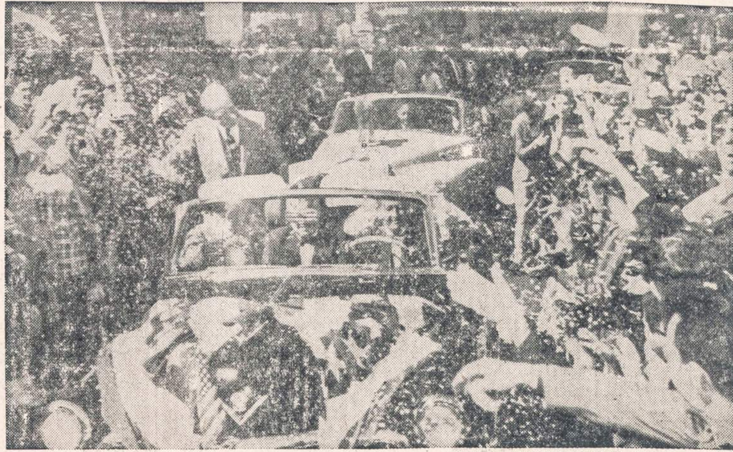
ADLAI MJESTAS PAGERBIA EISENHOWER'Į — Generalas Dwight D. Eisenhower Springfielde, Ill., Adlai Stevensono mieste, apibieramas su konfetti (smulkiai sukarpytas spalvotais popieriuokais), kai jo automobilį karavanas traukia per miestą.

Kiek paviešėję, svečiai išsiskirstė, o mes nuėjome miegoti. Kai išbudau ryto metą, dėdės jau nebuvo. Ant stalo buvo padėta man knyga. Tai buvo vadovėlis anglų kalbai mokytis. Gulėjo ten pat kvoteris. Vadinasi, buvau aprūpintas ir "dienpinigiais".