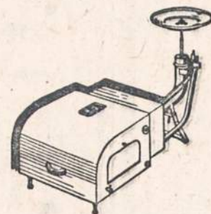
STANFLAME CONVERSION BURNER