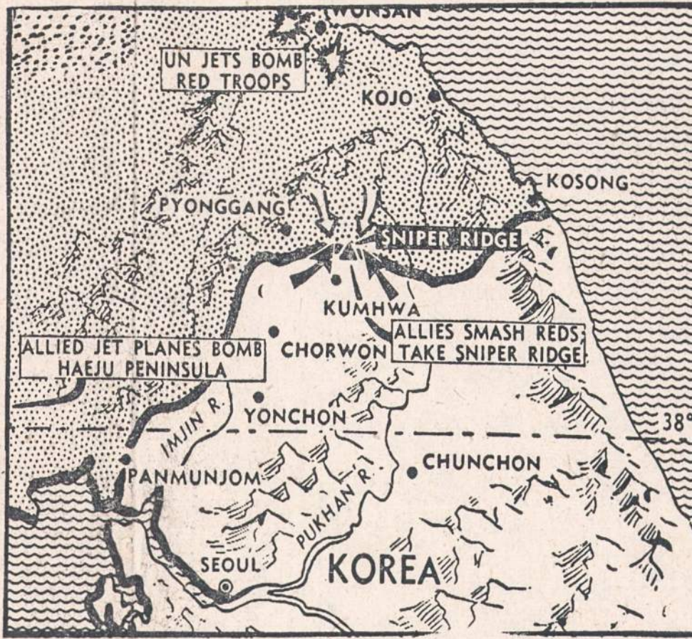
ISSTUMĖ RAUDONUOSIUS. — Jungtinių Tautų kariai, remiami sunkiosios artilerijos, puolė Sniper Ridge, Korėjoje, išblaškė 1,000 šaltaviršūnių komunistų. Sniper Ridge yra į šiaurę nuo Kumhwa. Orinės pajėgos bombardavo priešojunginius vakariniam Haeju pusiasalio krante ir Wonsan srityje.

—Amerika užsakė Graikijos fabrikams pagaminti ginklų ir karinių reikmenų už $11 milijonų. Gaminiai bus paskirstyti NATO nariams. Pačiai Graikijai tai reikią gerą dolerinės valiutos pajamų šaltinį.