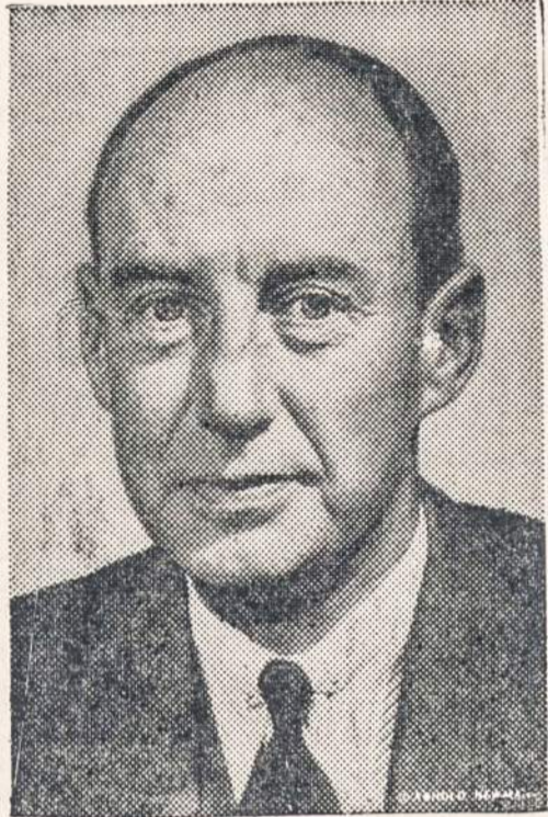
ADLAI E. STEVENSON