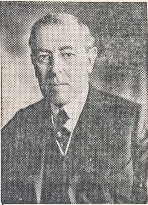
PREZ. WOODROW WILSON