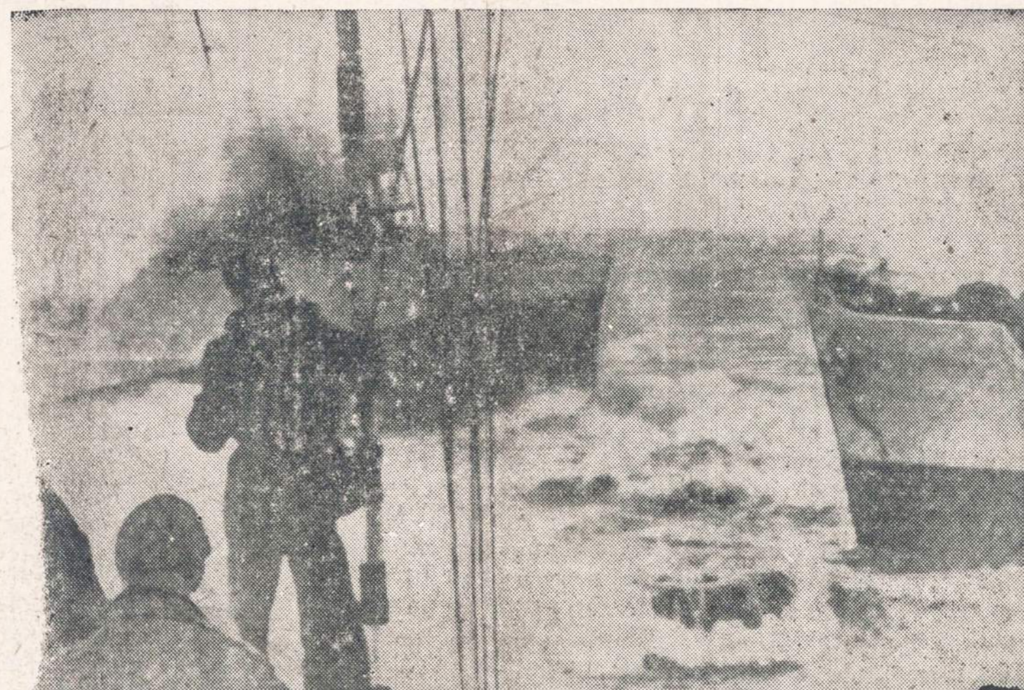
GELBSTI JŪRININKUS IS PERLUZUSIO LAIVO. — Gelbėjimo darbininkai, kurie vos iškėlė tris igulus narius iš perluzuso kariuomenės tiekimo laivo Grommet Reefer, buvo priversti dėl stipraus vėjo gelbėjimo darbus nutraukti. Ant laivo liko 36 igulus nariai, kurie vėju apsilus buvo iškelti mažais laiveliais ir malūnsparniu. Laivas perlužo pusiau netoii Leghorn, Italijoje.

Kompanijos, davusios kyšius, teisinasi, kad be kyšių unijos pareigūnams neįmanoma iškrauti ar pakrauti uostuose laivų.