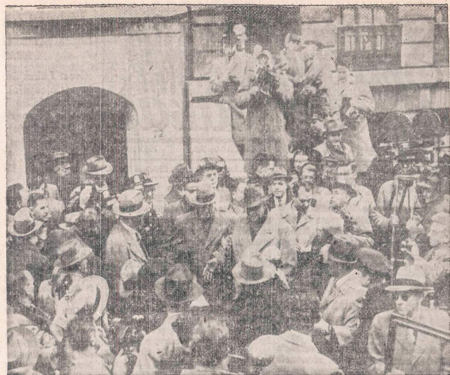
EISENHOWERIS IR MACARTHUR, UŽBAIGIA KONFERENCIJĄ. — Išrinktasis Amerikos Prezidentas Dwight D. Eisenhower (dešinėje) ir gen. Douglas MacArthur (kairėje) pasirodo iš John Foster Dulles namų, New York, po savo istorinės dvi valandas užtrukusios konferencijos. Policija daro jiems taką pro laikraštininkų ir susirinkusių kaimynų minią.

NAUJIENOS buvo ir tebėra geriausias Amerikos lietuvių draugas.