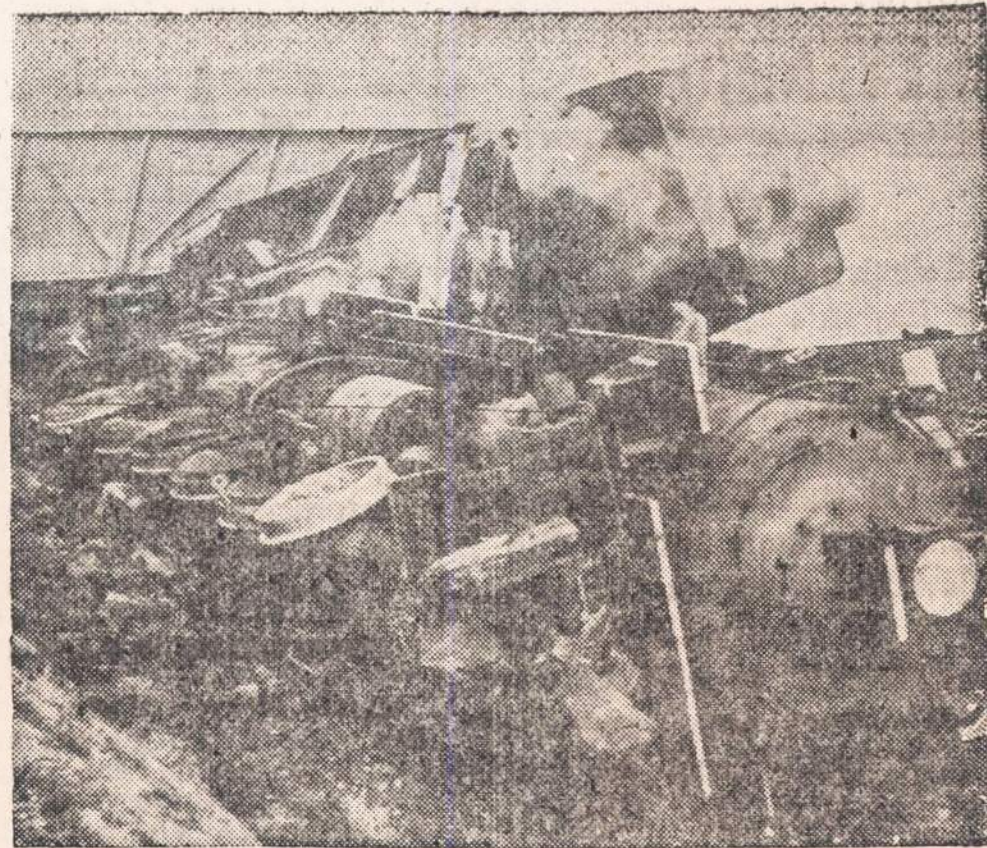
NUOJO NUO BEGIŲ. — Northern-Pacific prekinis traukinys Basset sankryžoje, Washington, nuėjo nuo bėgių užmušdamas du geležinkelius. Nelaimė įvyko 18 mylių nuo tos vietos, kur praėjusį savaitę nukrito karinis transporto lėktuvas "Globe-master".