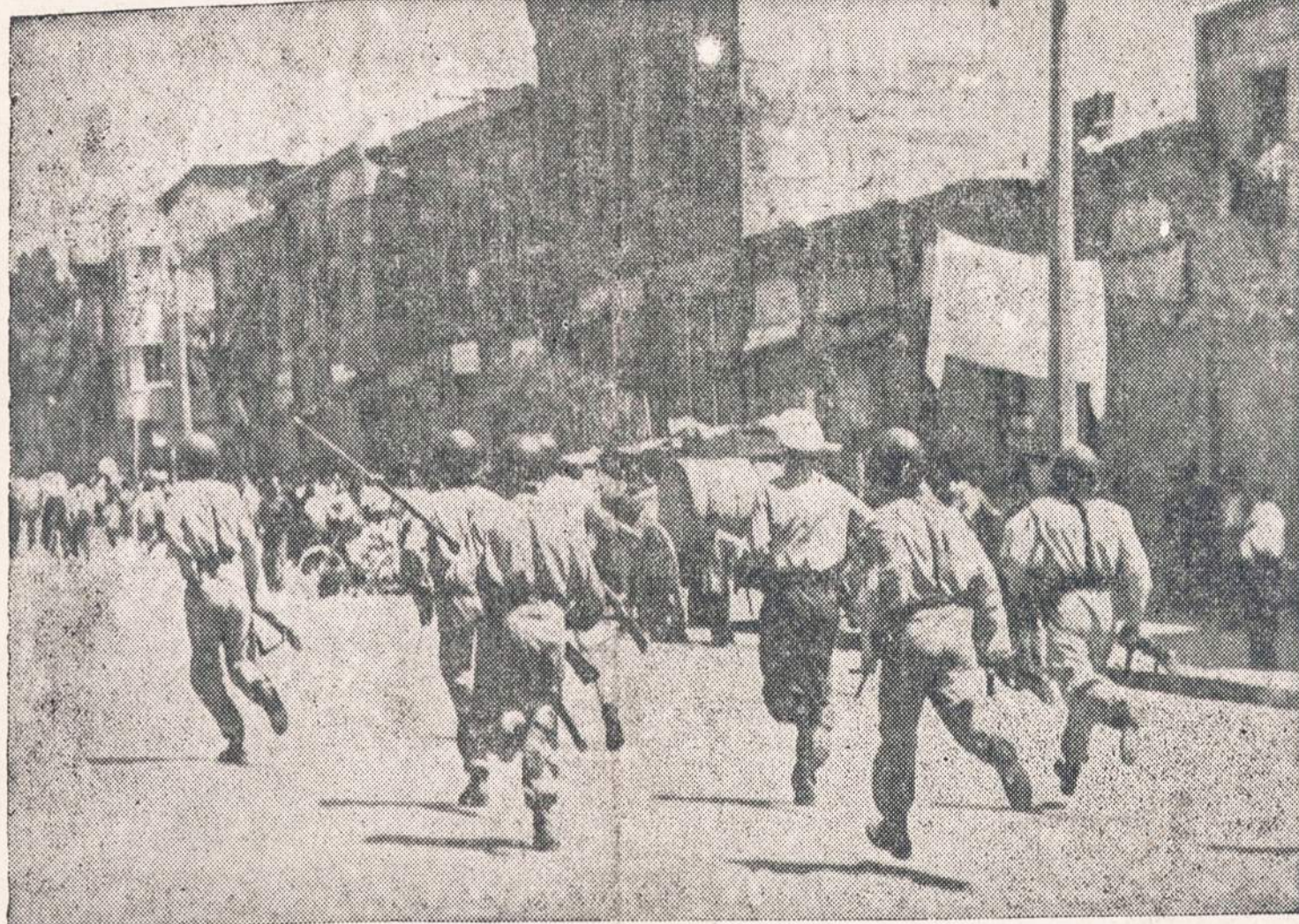
KOVA SU KOMUNISTAIS IRANE. — Čia parodyta, kaip praėjusi rugp. mėn. policija malsina komunistų sukeltus neramumus Teherane, kurie pareikalavo daugiau negu 300 gyvybių.

NEW YORK. — Amerikos komunistų dienraštis Daily Worker atsiderėjo sunkioje padėtyje. Seniau turėjęs kelias dešimtis tūkstančių skaitytojų, dabar numskio iki keliolikos tūkstančių. Dienraščio leidėjai kreipiasi verkšlendami į skaitytojus, jei jie nesumes $51,170, dienraštis užsidarys.