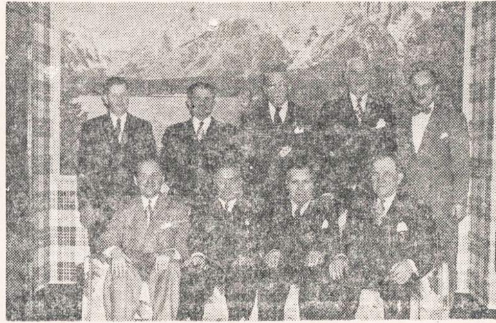
ŠV. ANTANO TAUPYMO IR SKOLINIMO BENDROVĖS DIREKTORIŲ TARYBA

Šv. Antano Taupymo ir Skolinimo Bendrovė ir vėl padarė pažangą per praėjusis šešis mėnesius, baigiant 1952 m. gruodžio 31 d. Daug pradėta naujų taupymo sąskaitų ir padaryta paskolų namams Ciceroje, Chicagoje ir priemiesčiuose. Viso 601 nauja taupymo sąskaita pradėta ir iš viso kapitalo padėta $1,584,724.24 visose taupymo sąskaitose. Išmokėta pagal pareikalavimą $926,490.77 per tą patį laiką. Bendrovė yra pasirošusi visada išmokėti pinigus savo taupytojams.