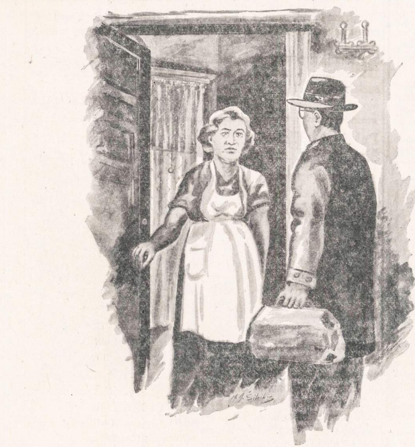
M. SILEIKIS — iliustracija

Ruduo mėtė lapus nuo medžių ir negailingai lietumi čaizė juo stingstancias šakas, bet gi mane supo nepaprasta nuotaka. Švilpaudamas grįžtu į Seminarijos namo. Turbūt kiekvienas mokytojas tokios džiaugsmingos nuotakos pagautas grįžta iš darbo, kai jam pasiseka praversti pamoką