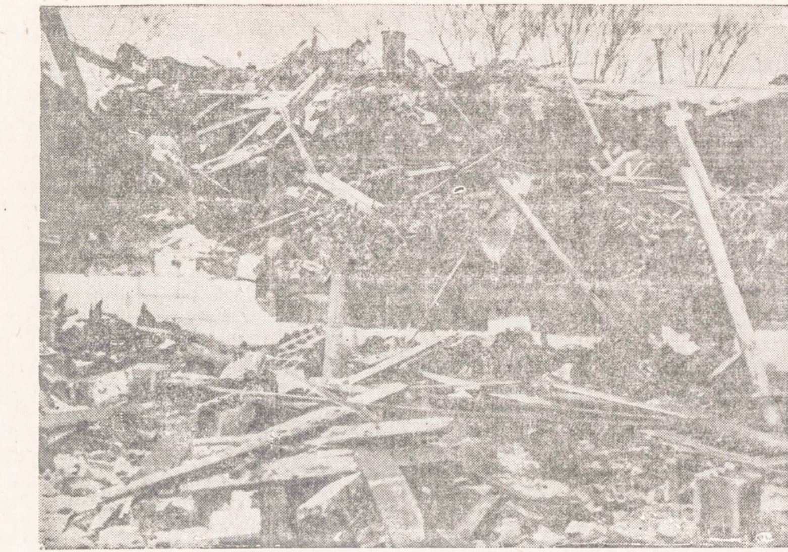
IESKO DVIJŲ ŽMONIŲ LAVONŲ. — Geibėjimo darbininkai ieško dviejų vyrų, palaidotų susprogdinto daržovių urmo prekybos pastato Muncie, Ind., griūvėsiuose. Sprogimas įvyko užsidedus etyleno dujoms, kurios buvo naudojamos bananams nokinti.

Nekentėkit daugiau be reikalo. Imkite laiko išbandyti Dr. Peter Gomozo. Daugiau negu liuosuojas — sužadinas skilvio funkciją tonikas ir išsivariantieji dujas vaistai — paruošti (ne iš vieno arba dviejų) iš 18-kos Gomozo žolių, šaknų ir augalų. Ypačinga Gomozo formulė padaro taip, kad tingios žarnos naujai pradeda veikti, padeda pašalinti užkemsamą suaudotą medžiagą, dujas atsirandančias dėl užkietėjimo ir išputimo — sudaro jausmą šilumos skilvyje. Pirkite Dr. Peter Gomozo savo kaimynystėje šiandien arba išsiųskite gauti mūsų specialų susipažinimui pasiūlymą.