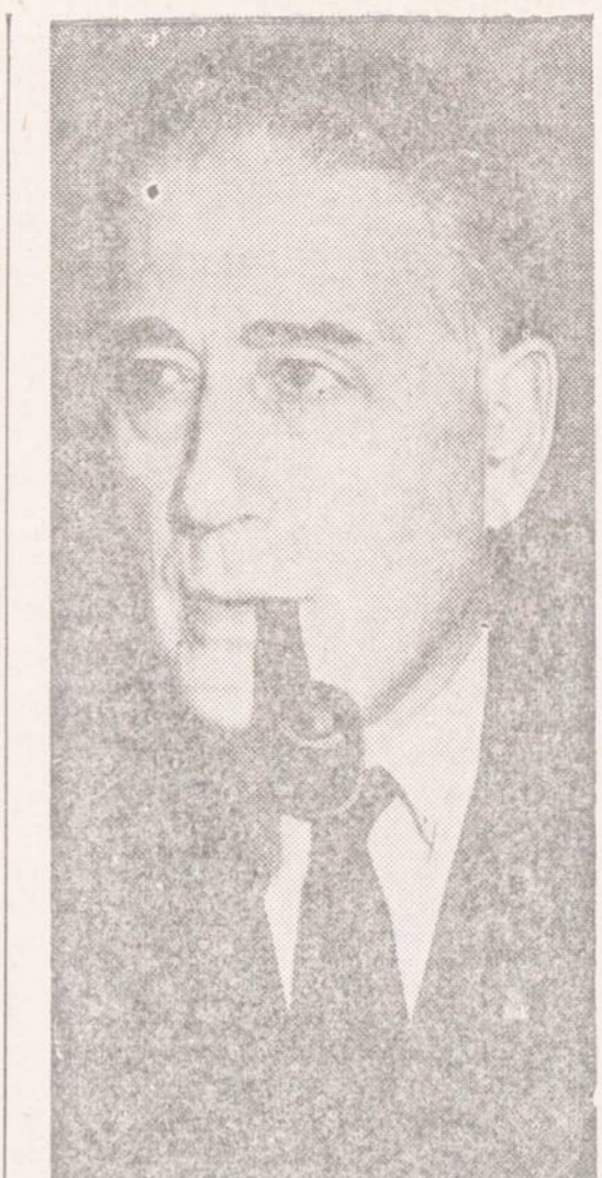
NAUJASIS FRANCIJOS PREMIERAS. — Rene Mayer (socialistas) sudarė naująjį Prancūzijos ministerių kabinetą, kuris gavo parlamento pasitikėjimą.

Kai juodu nuvyko į Las Vegas, policijos vadas neleido jiems mieste apsigyventi, todėl jie tu-