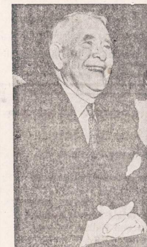
Pradedą naują karjerą. — Buvęs viceprezidentas Alben Barkley šypsodamasis praneša reporteriams, kad jis nuo vasario 1 d. pradeda naują televizijos komentatoriaus karjerą.

Suslovas primena Fedosiejevui šituos CK nutarimus ir klausia jį, kodėl jisai "visišškai