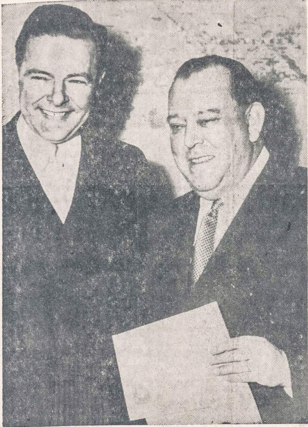
LODGE — DELEGACIJOS PIRMININKAS. — Henry Cabot Lodge, Jr., naujai paskirtas Amerikos delegacijos Jungt. Tautose pirmininku, įteikia savo kredencialus Jungt. Tautų generaliniam sekretoriui Trygve Lie.

Visuomenės simpatijos esančios bulių pusėj. Franco vyriausybė mano gauti dalį tų simpatijų, apsunkindama naujais potvarkiais toredorų verslą. Būsią reikalaujama, kad į kovą paleidžiami buliai būtų tinkamo svorio, geros sveikatos ir, kas svarbiausia, apsišarvavę savo natūraliais ginklais, — smailiais ragais.