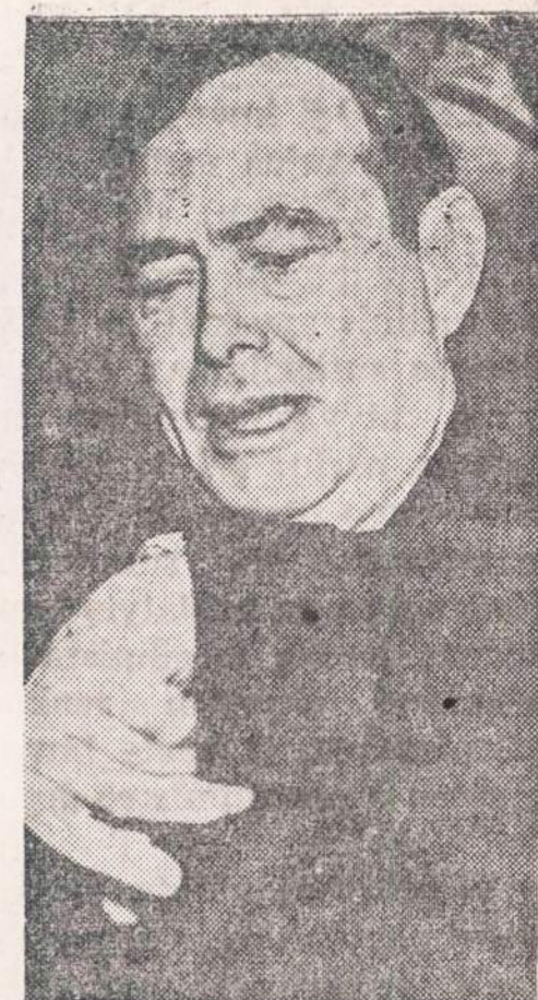
Patikrina laikrodį. — Rūmų kalbėtojas Joseph Martin, atvykęs į Baltuosius Rūmus, suderina savo laikrodį su Baltųjų Rūmų laikrodžiu.

Rusų solidaristų (NTS) oficialus organas "Possev", leidžiamas Frankfurte, Nr. 2/1953 (1953.I.11) įsidėjo solidaristų tarybos rezoliuciją ir nutarimus "dėl kai kurių strateginių laisvinimo kovos klausimų". Rezoliucijoje konstatuojama, kad Rusijoje bresta vidaus nepasitenkinimas ir revoliuciniam darbui dirva darosi palankesnė. Iš to konstatavimo padarytos tokios išvados: revoliuciniam sąjūdžiui reikia turėti savo dispozicijoje masinę, iš tautos gelmių kylančią organizaciją; revoliucinės jėgos turi nešti aišką būsimosios Rusijos santvarkos programą; svarbiausios revoliucinės jėgos turi būti pačioje Rusijos teritorijoje, kad tuo būdu būtų laiduotas jų nepriklausymas nuo kitų jėgų. Todėl rusų solidaristų taryba