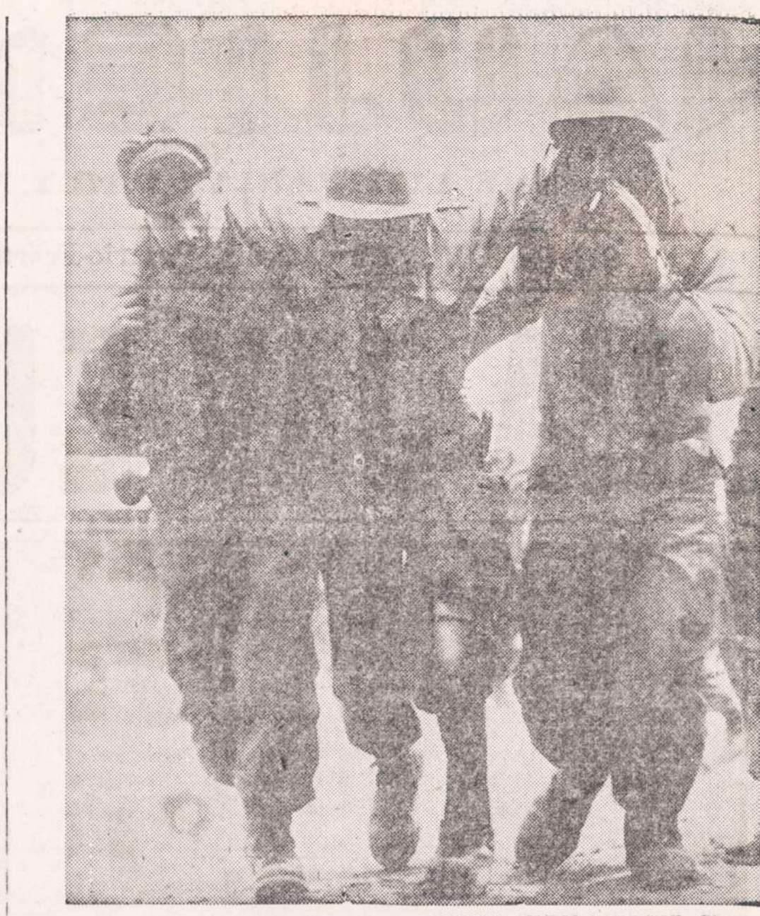
PAEDEDA SUZEISTAJAM. — Prie T-Bone Hill, Korėjoj, slaušin sužeistąjį kareivį du jo kovos draugai veda į tvartystimo punktą.

6234 So. Western Ave. CHICAGO Phone GROvehill 6-7575