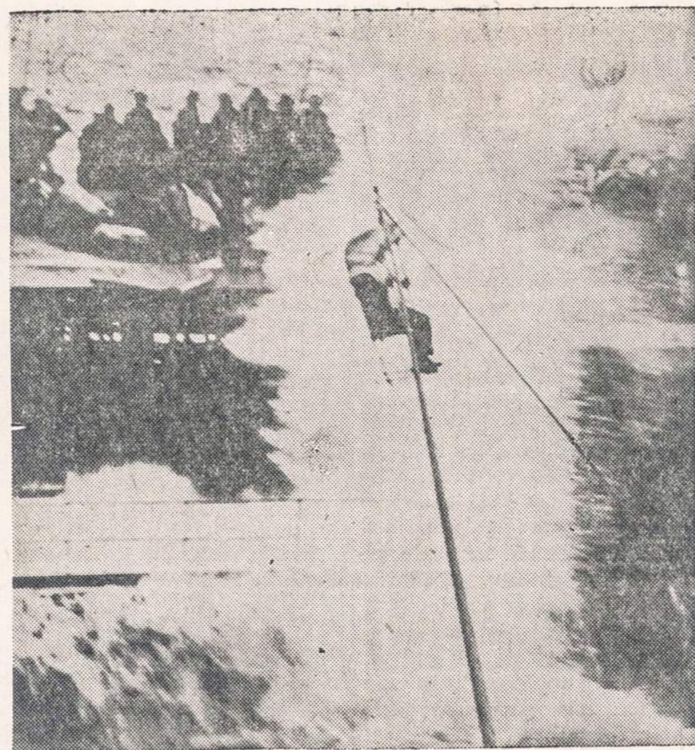
ISVENGĖ NELAIMĖS. — Miltiniška banga per truputį neuzkludė jūrininko, kuris audros metu prie rytinio Korėjos pakraščio buvo perkeltas iš sarvuotlaivio (viršuje) į kovos laivą "Missouri".