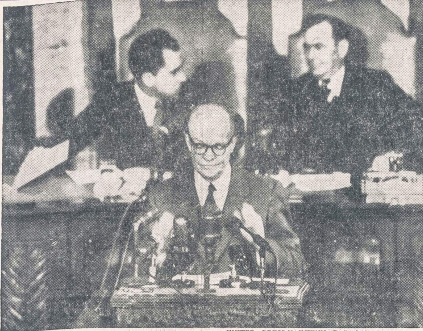
PREZIDENTAS KALBA. — Prezidentas Eisenhower sako Unijos kalbą Kongrese.

—3 lakūnai žuvo Big Spring, Tex., susidūrus aerodrome dviem srausminiam lėktuvams.