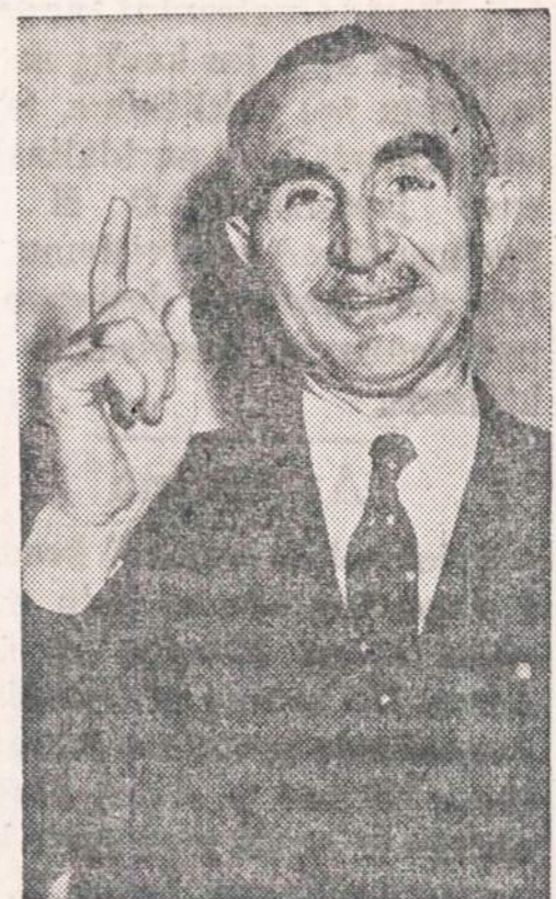
Morse prieš Wilsoną. — Sen. Wayne Morse (Oregon) vedė aštrią kovą prieš Charles E. Wilson patvirtinimą Gynybos sekretorium. Tą kovą pralaimėjęs Morse apalpo.

Ne tik malonesnis, bet ir saugesnis. Sovietų Rusijoje ir jos satelituose Stalino tarnai dažnai yra šaudomi ir kariami. Kaip gi norės tenai važiuoti tie škurnikai, kurie neblogai verčiasi Amerikoje, gaudami nebologą atlyginimą už žmonių mulkinimą?