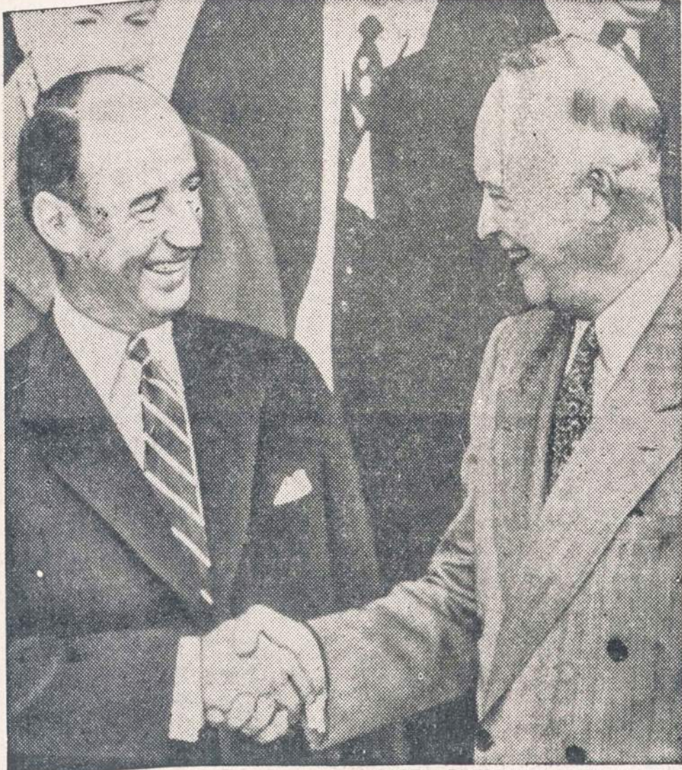
Prezidentas Eisenhoweris sveikinasi su buv. demokratų partijos kandidatu ir prezidentus Adlai Stevensonu. Pastarasis aplankė prezidentą ir su juo kartu pusrūčiavo.

Gen. Chennault reikalauja po tęsti kovą su Kinijos komunistais, nes kol jie valdys Kiniją, taika Tolimuosiuose Rytuose esanti neįmanoma. Chennault sako, kad karui su komunistine Kinija nereikėtų nė vieno Amerikos žemyno kovotojo (išskyrus laivyno ir aviacijos pagalbą).