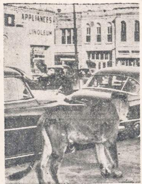
Lūtas stebi judėjimą. — Memphis, Tenn., pabėgo iš narvo du cirko liūtai. Vienas jų parodytas stebis miesto judėjimą. Po kelių minučių abu liūtai buvo suvaryti atgal į narvą.

Naujienietis pataria savo draugui užsirašyti NAUJIE NAS