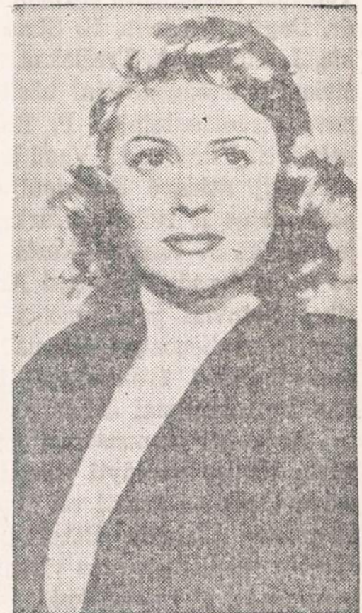
Vaidins vyriausią rolę. — Naujai stotomas filmas „Lucretia Borgia“ vyriausiąją rolę vaidins aktorė Mar'ia Carol, kuri tai rolę buvo parinkta iš dvylikos kandidatų.