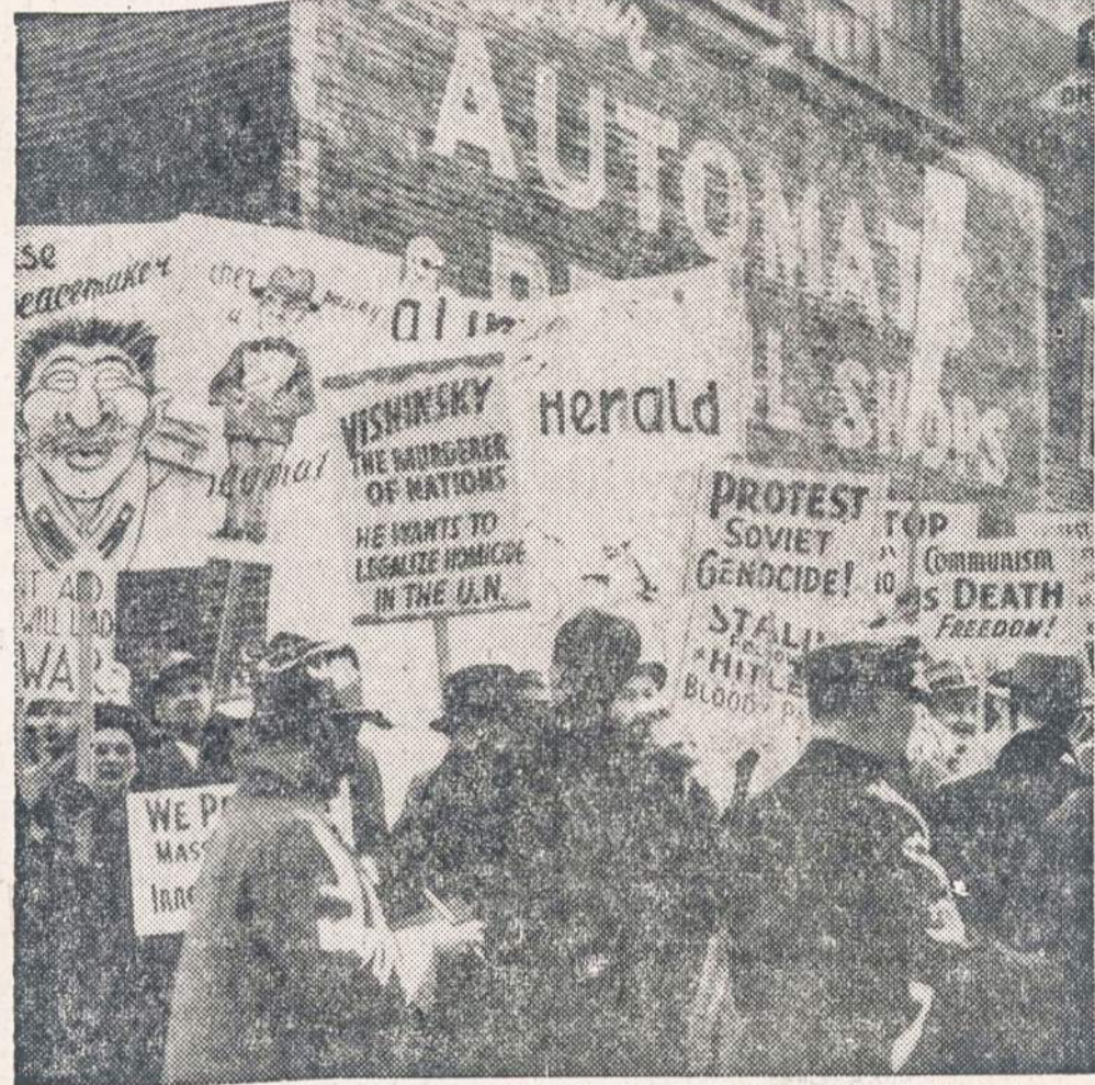
PIKETAVO VIŠINSKI. — Atvykstantį į Jungt. Tautų posėdžius Sovietų Sąjungos užsienio reikalų ministerį Višinskį New Yorke sutiko piketuotojai su gausybe plakatų. Neabejotinai, Višinskis labai apgailestavo, kad jo enkavedistai neturi čia galios.

Paskutinėmis dienomis buvo išmėtyta atsisaukimų, kurstančių sudaniečius prieš visa, kas ne komunistiška ir ne sovietiška. Policija suėmė 3 asmenis.