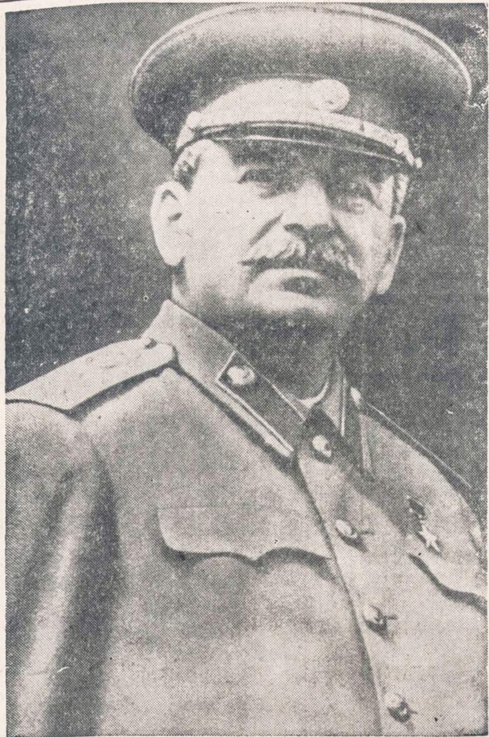
JOSIFAS STALINAS, VISARIONOVIČIUS, sunaikinęs Nepriklausomą Lietuvą ir atsakingas už tūkstančius brolių seserų gyvybes, baigė savo kruviną viešpatavimą.