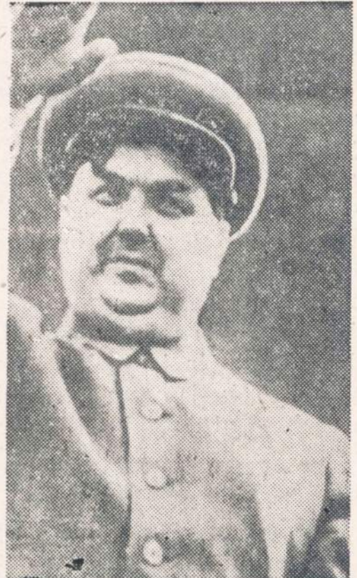
GEORGI MALENKOV, naujasis SSSR diktatorius

—Kovo 17 d. JT vyr. armijos vadas gen. Clark išvyks į Indo-kiniją studijuoti tenykštį pran-cūzų frontą prieš komunistų partizanus ir būdus, kaip Ame-rika gali geriausiai padėti.