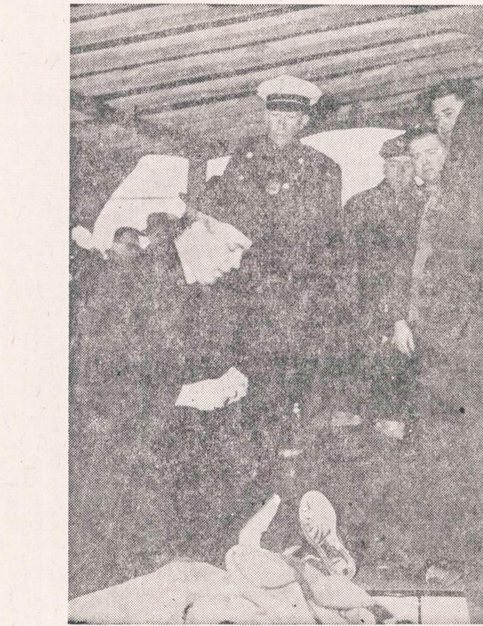
SUDEGĖ 14 ŽMONIŲ. — Anheuser-Busch kompanija, Newark, N. J., kilo gaisras, kuriame sudegė 14 darbininkų. Kiti 24 sužeisti.