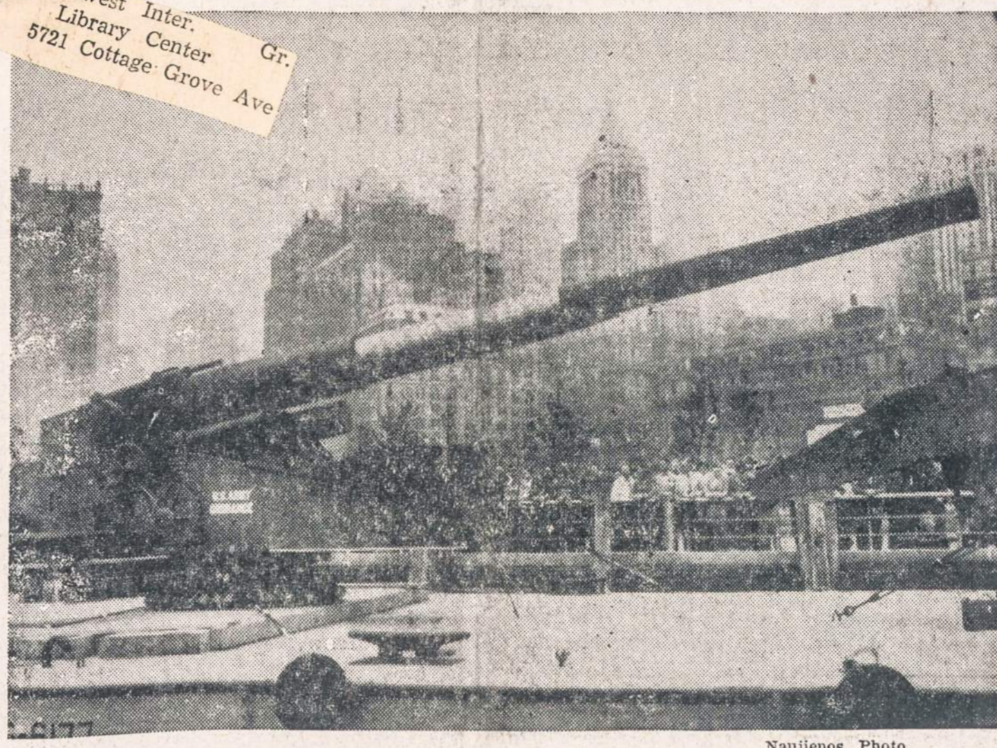
New Yorko Battery parke susirinko didžiulė minia pažiūrėti atominės kanuolės, kuri sveria 85 tonas ir yra 84 pėdų ilgio.

Dabar vieton Stalino brukamas komunistų partijos centro komitetas, bet jis komunistų spaudos rašėjoms dar nesiseka taip garbinti, kaip Stalinas. Mat, Stalino garbinimui priimta terminologija centro komitetui netinka, o kita dar nėra nukalta, liko tuščia vieta.