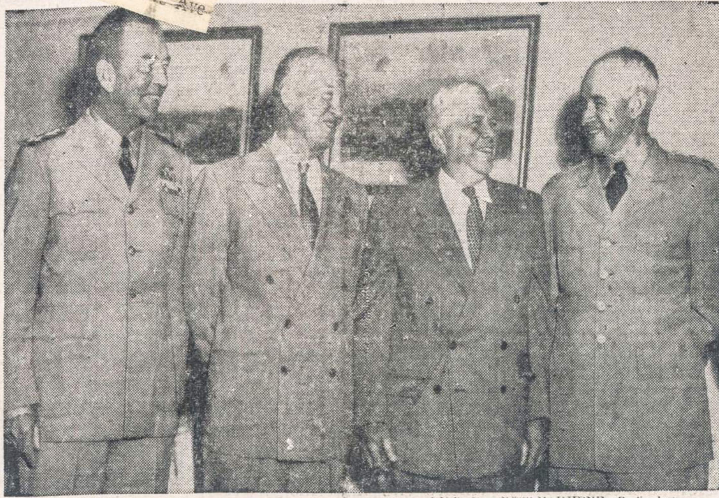
Prez. Eisenhoweris su karo sekretorium Ch. Wilsonu. Iš kairės adm. Radford, iš dešinės gen. Bradley, naujasis ir ligšiolinis vyr. štabo viršininkas.