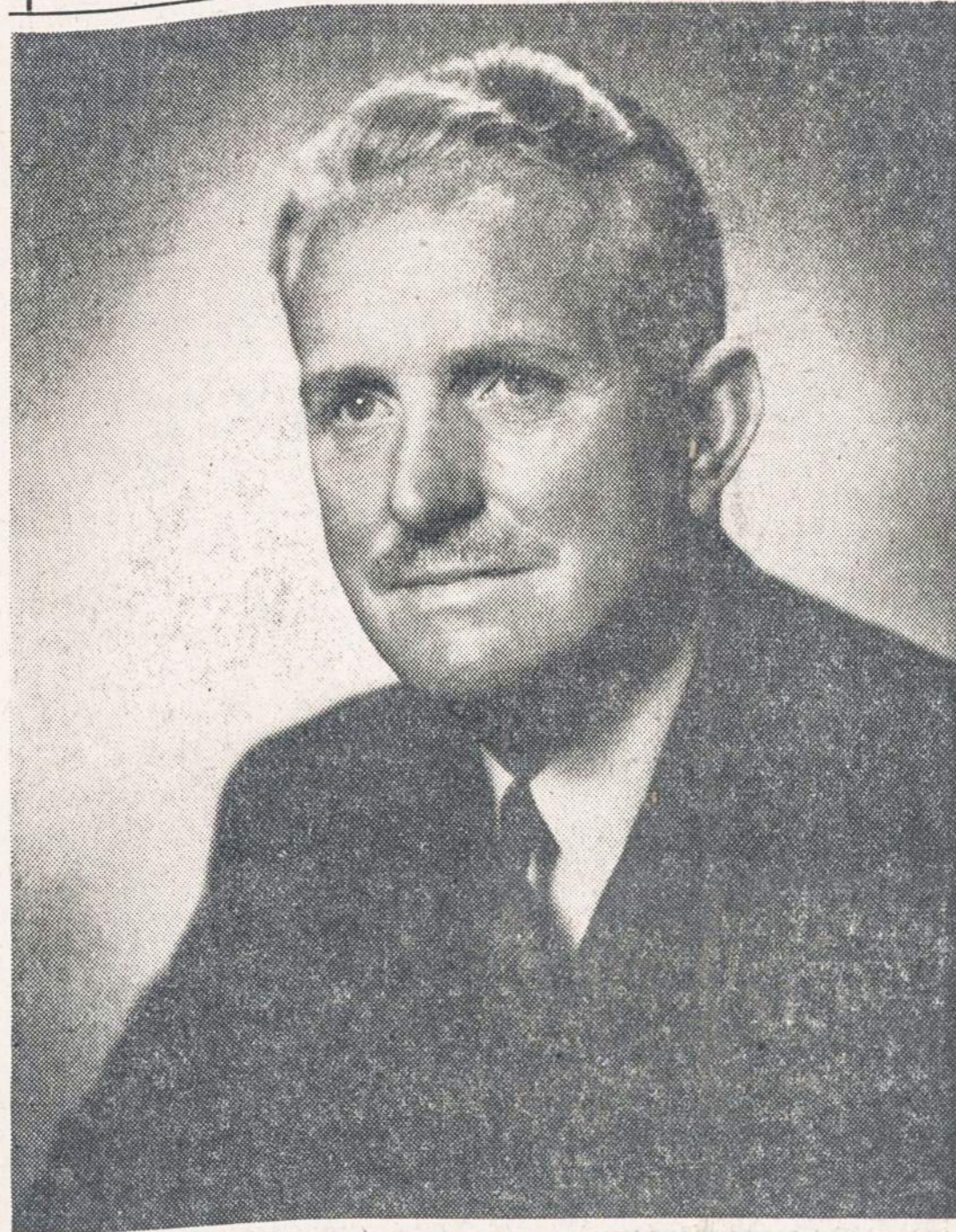
is Chicago 3-jo distrikto, geras lietuvių draugas, nuo pat pradžių aktyviai rėmęs Kersteno Rezoliuciją. Prieš Taisyklių Komiteto posėdį vakar davė labai stiprų pareiškimą, siūlydamas Rezoliucijai duoti eiga.