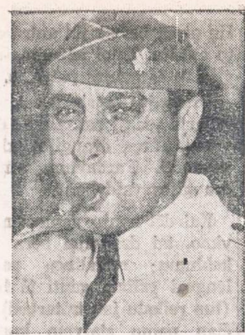
Iš Korėjos atvyko į San Francisco majoras James Jabara, kuris tarnaudamas aviacijoje numušė 15 priešų lėktuvų. Jis vyksta į Wichita, Kansas, kur su savo šeima praleis dešimt dienų. Po to jis vyks į Syracuse, N. Y. Ten jo tarnyba bus susijusi su oro gynyba.