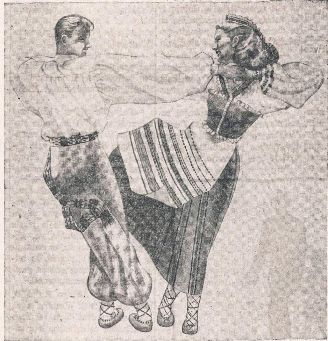
SOKS ATEITIES SOKĖJAI