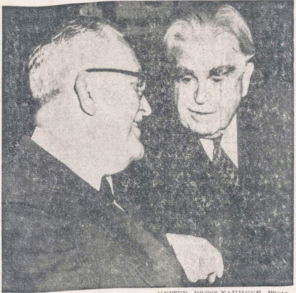
Penki kabineto nariai ir Piliečių patariamasis komitetas, susidedas iš 122 asmenų, susitiko su Senato banku komitetu.

DURBAN, Pietų Afrika. — Knygų pardavėjai praneša, kad Pietų Afrikos muitinėse "sukliškai paskelbė, jog nuo šio mėnesio 21 d. jie pradės streiką, jeigu kompanija nepatenkins jų reikalavimų.