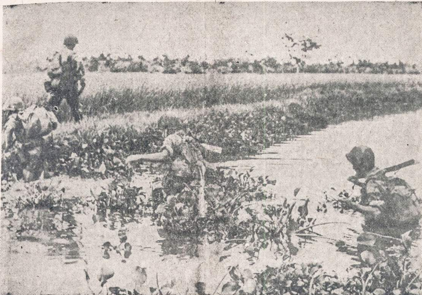
Prancūzų ofenziva Indokinijoje (Hanoi srity) tebesitęsia. Jos tikslas yra suardyti komunistų ginkluotų jėgų susisiekimą.

Jis ruošia Kongresui pasiūlymą ištaisyti įstatymą, kad sudraustu nesąžininguosius valdininkus, kurių esą ir pačiame išdo departamente.