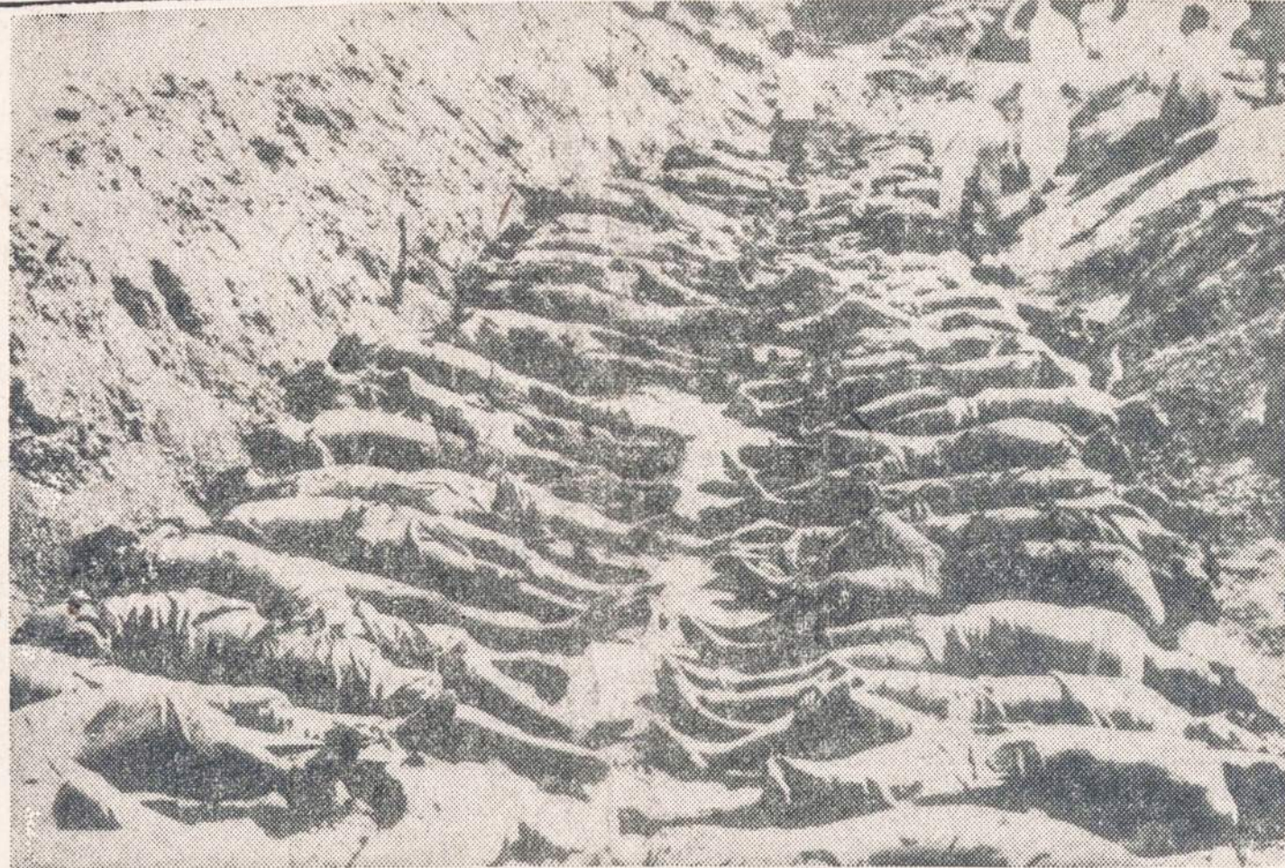
JAV armijos pareigūnai paruošė raportą, kuris rodo, jog komunistai Korėjos karo metu įvairiais būdais nukankino 29,815 ir jų nagus patekusių asmenų. Jų tarpe buvo 6,113 amerikiečių. Nuotrauka parodo, kaip komunistai žudė suimtus belaisvius.

"Šiandien, rašo anglų laikraščiai, nieks Washingtonė nebe vadina prezidento populiariuoju "Ike", o ir pats Eisenhoweris, atrodė, nebesileistų net laukiniais arkliais įtraukiamas iš naujo kandidatuoti į prezidentus".