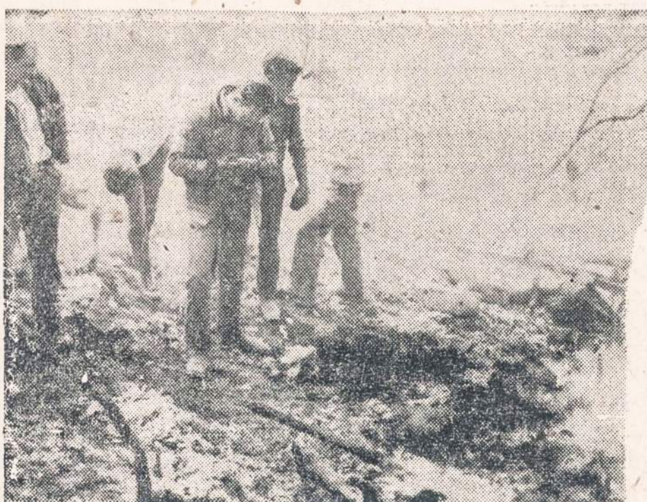
Britų lėktuvas nukrito ir susidaužė netoli Half Moon Bay, Kalifornijoje. Žuvo visa lėktuvo įgula ir keleiviai, — iš viso 19 žmonių. Iš Australijos (Sydney miesto) lėktuvas skrido į San Francisco.

Į Argentinos lietuvių istoriją vėl įžengė nauja data, kuri ateityje liudys, kad lietuvių tautos sūnūs ir dukros uoliai dirbo siekdami išlaikyti patriotinę — tautinę bendruomenę ir kovoti už bolševizmo pavergtos Tėvynės laisvę ir nepriklausomybę. Ta istorinė data yra 1953 metų spalio mėn. 18 diena, nes tą dieną įvyko pirmasis Argentinos Lietuvių Bendruomenės atstovų suvažiavimas. Suvažiavimdarė pasididžiavimą ir kartu nekantrų lūkestį, kada jis grįš ir ro ir Apylinkių vadovaujančius