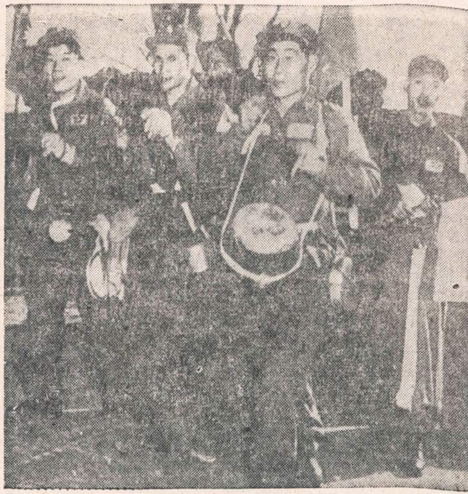
Belaisviai (buvo Kinijos ir Šiaurės Korėjos kariai), kurie atsivertė prieš namo, maršuoja neutralia zona Panmunjome. Jie neša nacionalistines Kinijos vėliavas.