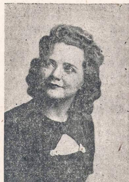
ONUKS STEPHENS solo chorui pritariant