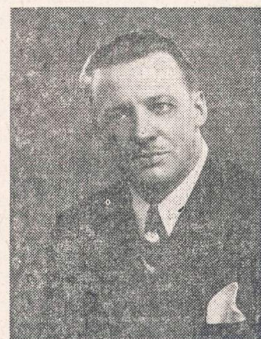
KAZYS STEPONAVICIUS, choro ir orkestro vedėjas