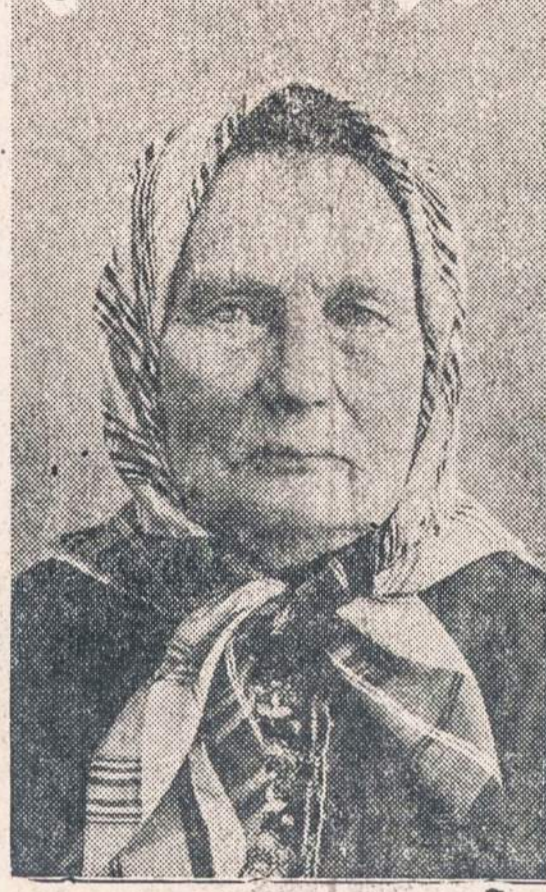
JULĖ ŽEMAITĖ, rašytoja