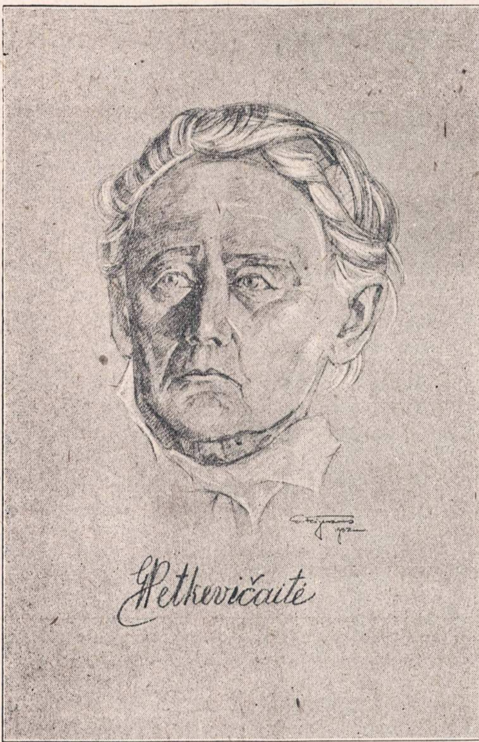
Rašytoja GABRIELĖ PETKEVIČAITĖ-BITE