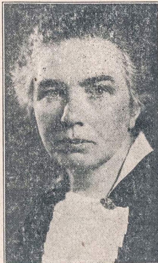
FELICIJA BORTKEVIČIENĖ, "Lietuvos Žinių" red.ktorė ir moterų kultūros veikėja