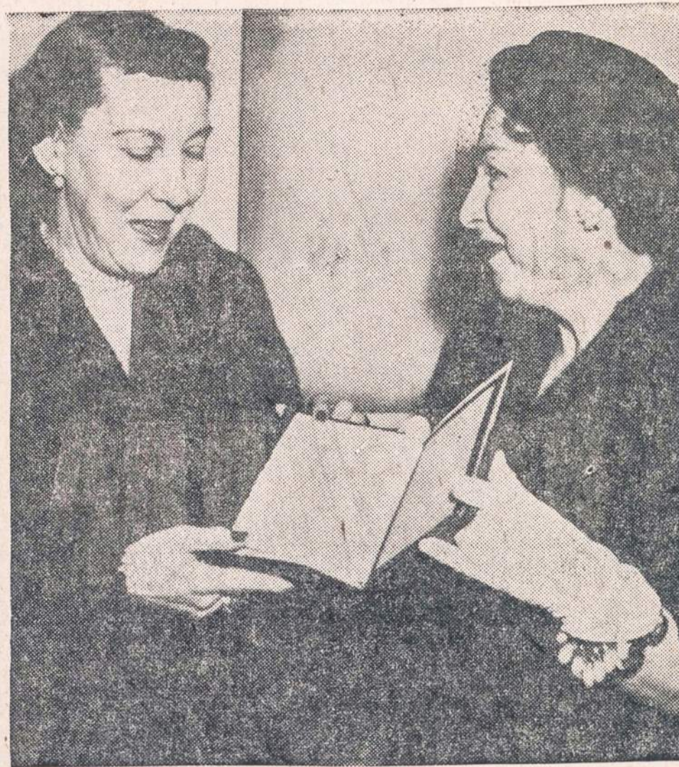
Prezidento Eisenhowerio žmonai Mamie buvo išteiktas originalis laiškas, kurį Mary Todd Lincoln (prezidento Lincolnno žmona) parašė Anglijos karalinei Viktorijai.

Praktiškiausias ir beveik tinkamiausias pasirinkimas,—tai kostiumėlis, vilnonės ar šilkinės medžiagos. Jis visur pui-