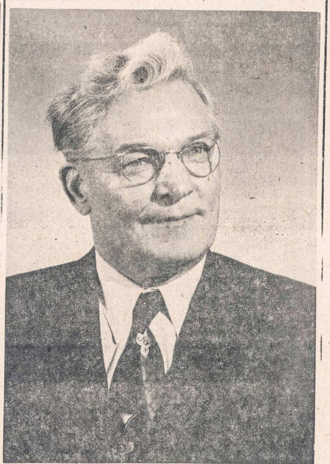
Nuolatiniai skaitytojai 40 metų Jubilėjaus proga sveikina visus NAUJIENŲ štabo narius ir linki jiems daug energijos dienraštį dar ilgus metus leisti.

Dar jeigu užpilsite trupučių rūgščios smetonos ir apibarstysite tarkuotu sūriu, tai šeima vienbalsiai nutars, kad jų mama yra pasaulio geriausia virėja. Pamėginkite.