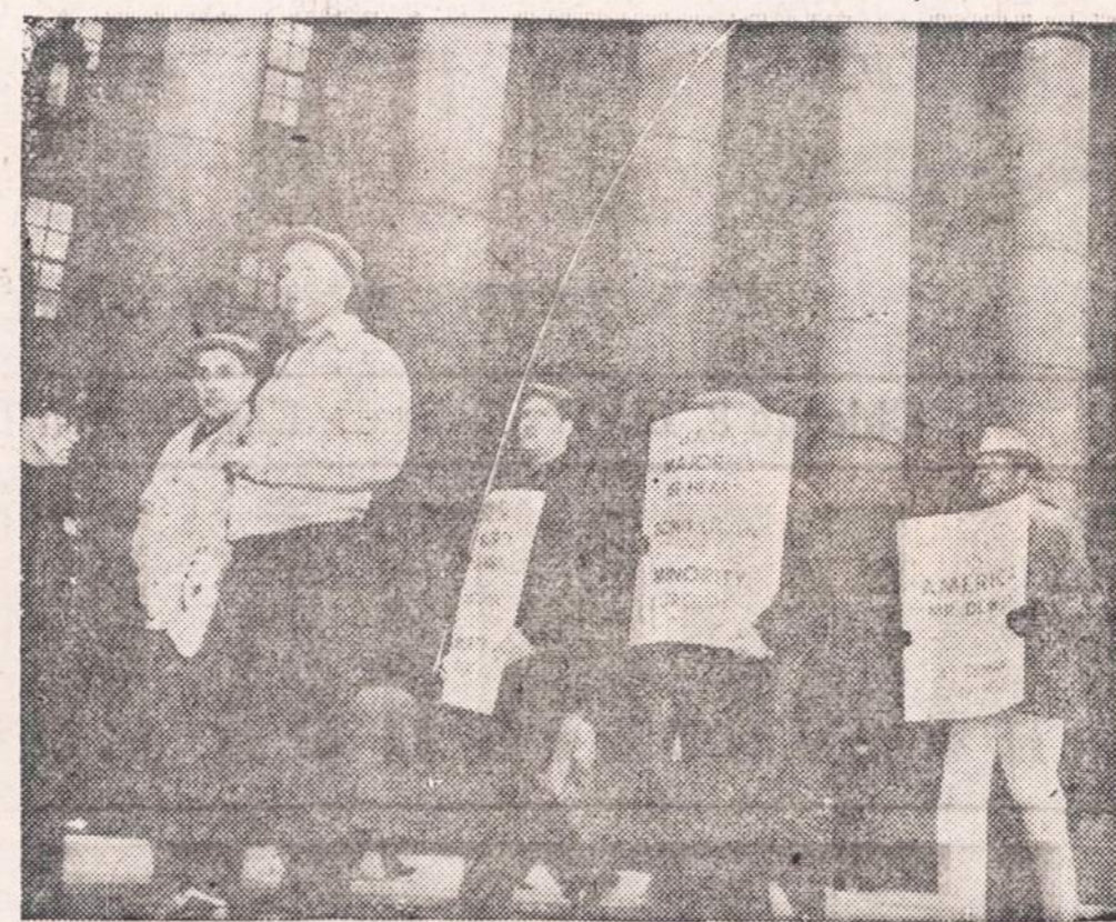
Dalis krovėjų tebetiesia streika New York'e. Jie piketuoja federalio teismo rūmus, kadangi ten bus svarstomas Nacionalios darbo ryšių tarybos reikalavimas nebusti nedrausmingus streikininkus ir jų vadus, unijos pareigūnus.