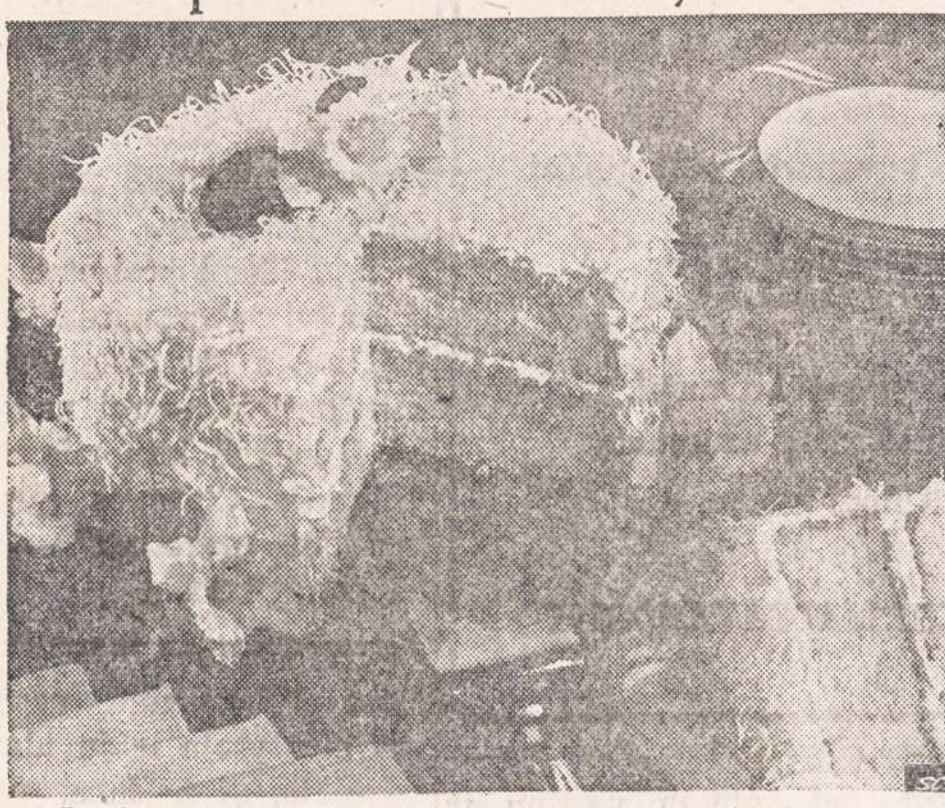
Parties galore in the months ahead and the wise hostess will keep a supply of packaged cake mixes in her pantry, so she can put a cake together with no effort. For instance, the cake pictured here is a tender, velvety white cake, frosted all over with a fluffy frosting and coconut lavishly sprinkled on top and sides. It's a beauty—you'll want to make it often!