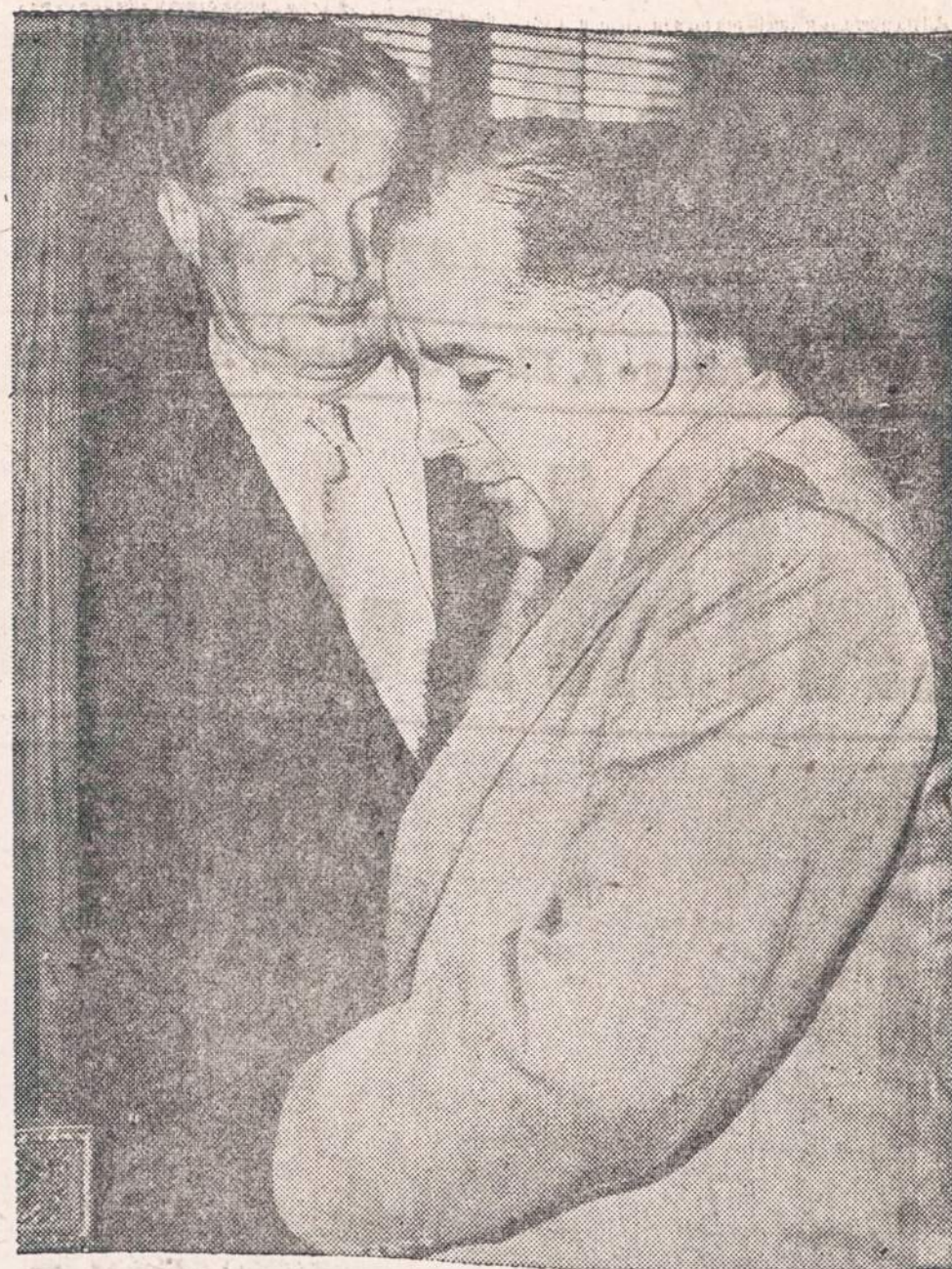
PO SLAPTO POSEDZIO. — Sen. Joseph McCarthy (dešinė) ir sen. Stuart Symington (dem.-Mo.) po slapto komiteto posėdžio, kuriame buvo svarstomi pagrindiniai dėsniai, kaip tirti McCarthy ginčus su armijos departamentu.

Stasys Varkėnis. Chicago, 1954.3.16. (GALAS)