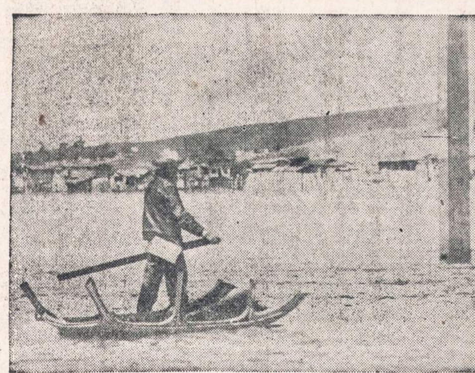
PAKELIUI Į JAV. — Meksikietis, norėdamas patekti į Jungtines Valstybes, plaukia seno automobilio stogu per patvinusią pasienio upę Tia Juana.

— Žemės drebėjimas, pajustas Ispanijoje, buvo užregistruotas ir Italijos seismografinukentėjo 23 japonų žvejai. .... fų.