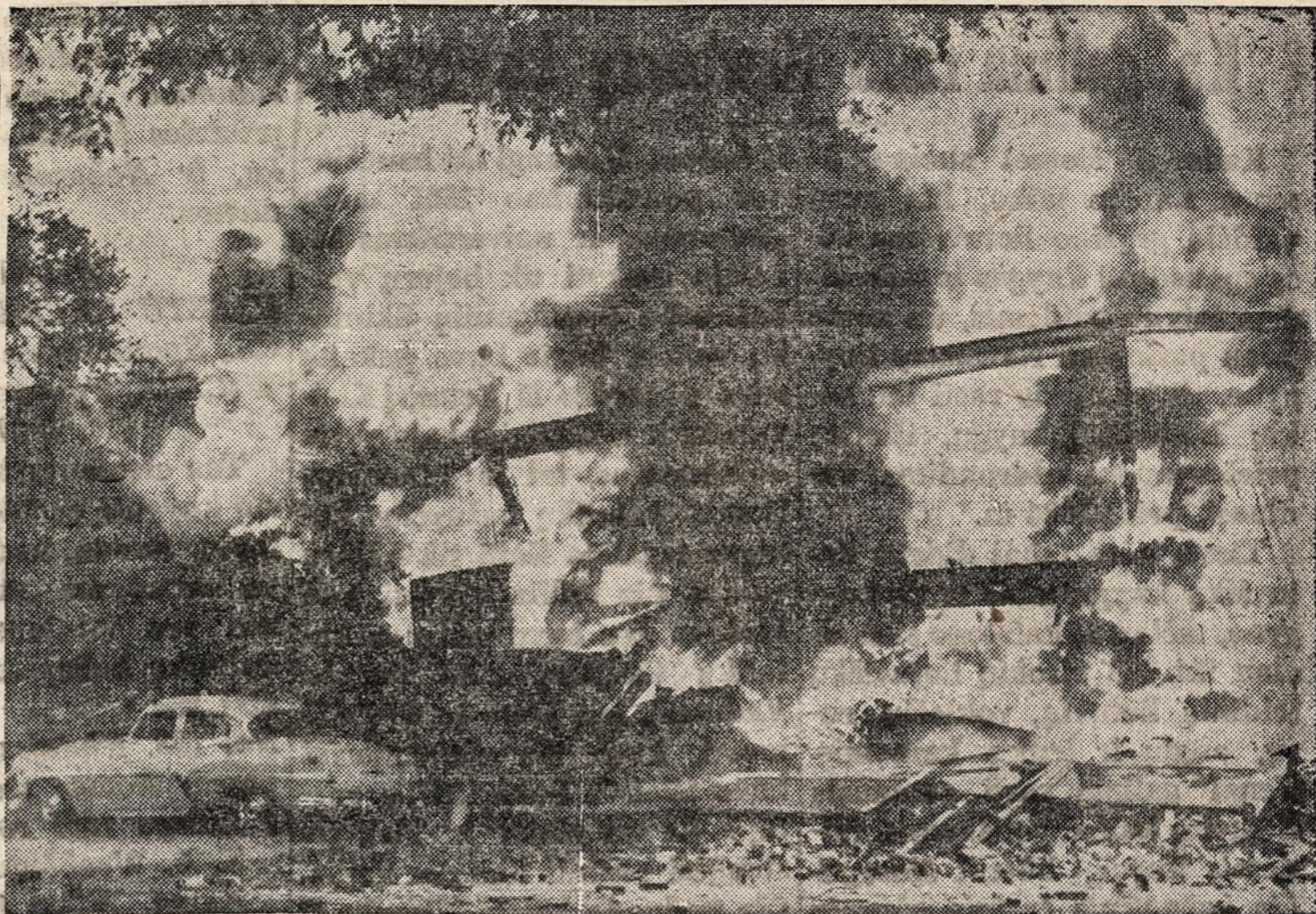
Pietinėje St. Louis miesto daly vaistų įmonėje įvyko eksplozija ir gaisras, kurio nuostoliai siekia $220,000. Dėl eksplozijos žuvo 5 žmonės, o 32 buvo sunkiau ar lengviau sužeisti.

5 — NAUJIENOS — CHICAGO 8, ILLINOIS 1954 M. BIRŽELIO 19 D., SEŠTADIENIS