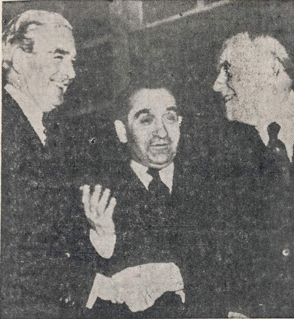
Kai JAV sekretorius John Foster Dulles (dešinė) nuvyko i Paryžių, tai jį pasitiko Prancūzijos premjeras Mendes-France (vidury) ir Anglijos užsienio reikalų ministeris Anthony Eden. Jie aptarė Indokininijos ir kitus reikalus.

Baigdamas laikraštis apgalvina, kad tai nebuvo sportinis džiaugsmas; tai buvo nacionaliniai jausmai, kuriais taikoma i pavojingus instinktus.