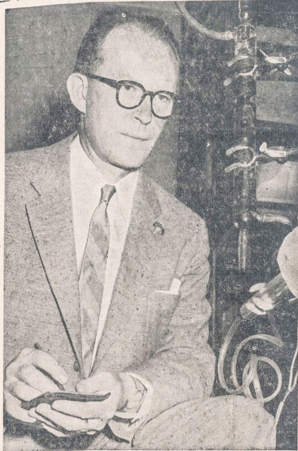
Dr. Willard Frank Libby, chemijos profesorius branduolinių studijų institute prie Chicago universiteto, prezidento Eisenhowerio buvo paskirtas atsakomingsoms pareigoms atominės energ. komisijoj.

HONG KONGAS. — Iš Peipingo pranešama, kad Tibeto, budistų vienuolių valstybės, galva Dalai Lama, 18 metų, padarė mandagumo vizitus aukščiesiems Kinijos komunistų vadams Mao Tsetungui ir Chou-Enlai. Dalai Lama ir jo padėjėjas Pančen Lama, 17 metų, dalyvavo ir pirmojo "parlamento" atidaryme.