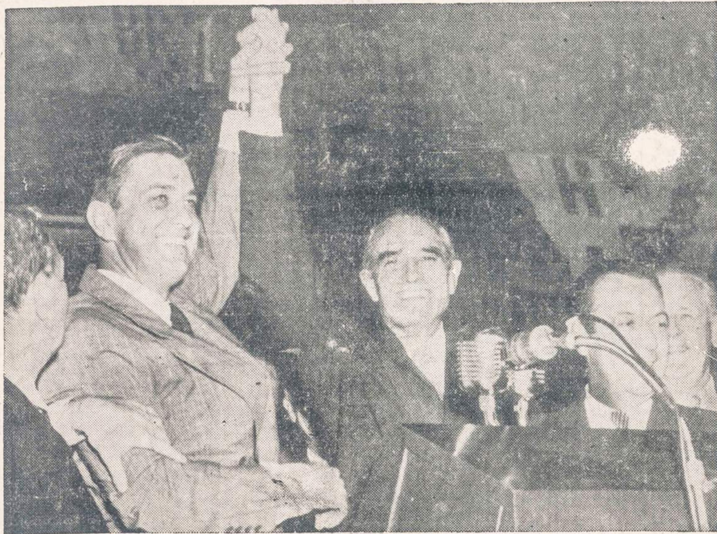
Franklin D. Roosevelt, Jr. (kairėje) laiko Averell Harrimano ranką kaip pergalės ženklą. Demokratų valstybės konvencija pasirinko Harrimano kandidatą į New Yorko gubernatorių.

Kabinetas su sektantais SAIGONAS, Vietnamas. — Premieras Diem, besivaidijęs su armija, pertvarkė savo kabinetą, į kurį iš 22 narių 11 yra iš senojo kabineto. Į vyriausybę Diem buvo priverstas įleisti ir du religinių sektų atstovus.