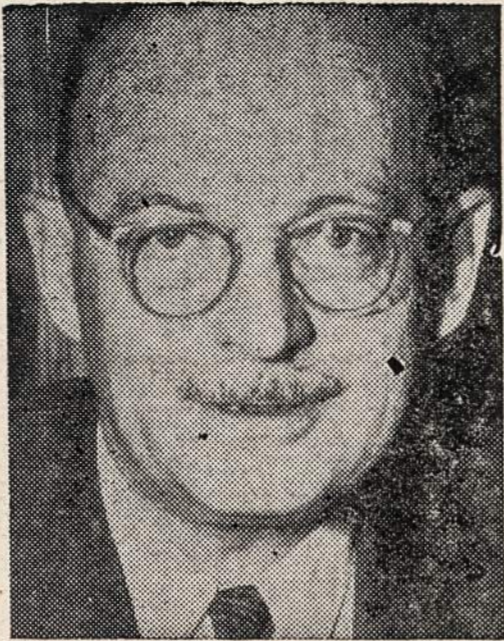
Owen Lattimore, Tolimųjų Rytų specialistas, kuriam iš naujo keliamą byla. Jury nusprendė, kad jis melavęs, liudydamas Senato vidaus saugumo subkomitetui 1952 metais. O tada jis liudijo, kad ne tik nepriklausęs komunistams, bet nesąs nė jų simpatizatorius.

Už geležinkelio pylimo parke buvo įvairiomis kryptimis praveistos alėjos, kurioms vasarotojai davė būdingus pavadinimus, kaip antai: "Pasimatymo alėja", "Meilės alėja", "Nusivylimo alėja", "Persiskyrimo alėja", "Atodūso alėja", "Vilties alėja", etc. Parko šone buvo geležinkelio stotis. Jungė Alytus — Marijampolė — Kaunas. Kaip prie stoties, taip ir toliau, kiek akys užmatė,