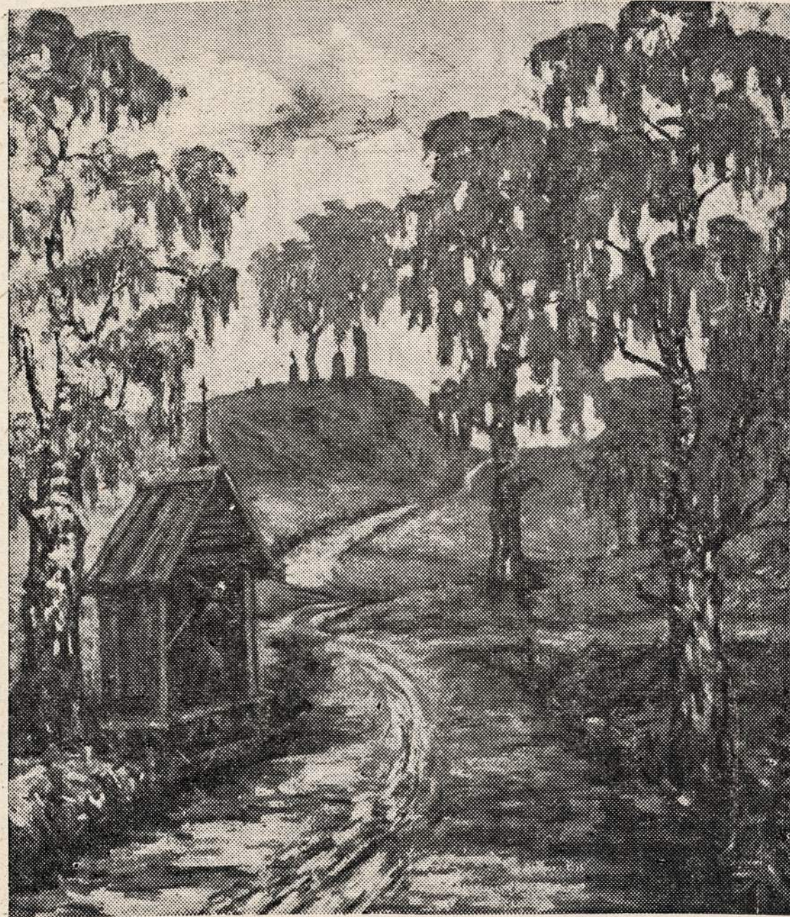
IGN. ŠLAPELIS — Gamtaavaizdis

Šaltuos miškuos numirę lapai šlama. Į apsiaustą sukruvintą supiesi. Ir medžiai — tartumei benamiai Sausas rankas į tave tiesia. Jaunystė — rudenio gėlėlė