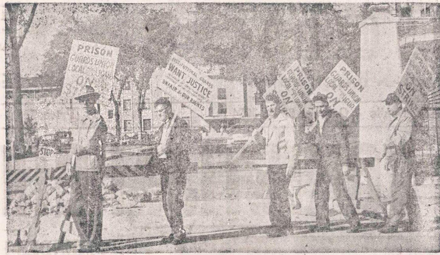
Kalėjimų sargų unijos nariai paskelbė streiką. Indijos valstybės kalėjimas, kuris yra Michigan City, liko be sargų. Streikuojančių vietą užėmė milicininkai. Unija pareiškė, jog streikas buvo paskelbtas dėl to, kad buvo atleidžiami sargai, kurie atsisakė pasirašyti specialias kortas su pareiš-kimais, jog jie bus "lojalūs Indijos valstybei".

Užsakymus adresuokite: NAUJIENOS, 1739 S. Halsted Street, Chicago 8, Ill.