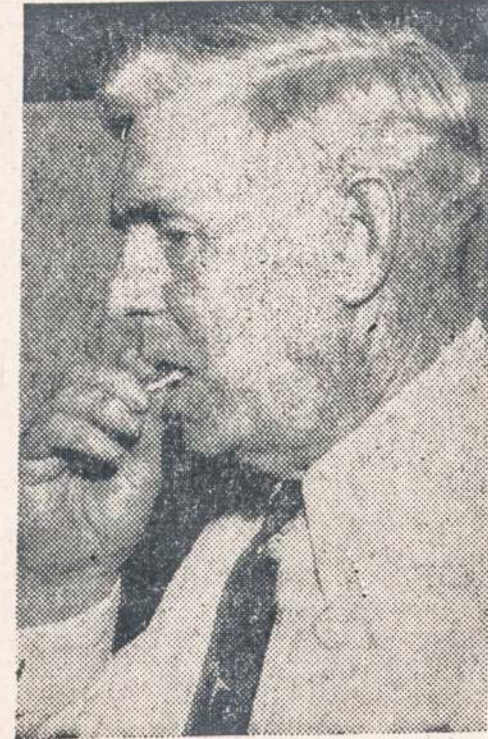
Patrick V. McNamara, demokratų kandidatas, laimėjo rinkimus ir buvo išrinktas senatorium iš Michigan steito. Jo oponentas buvo sen. Homer Ferguson.

Prezidentas pripažino, kad komunistai, ypač Vjetname, yra suorganizavę pavojingas laisvei pajėgas. Grįžęs iš Indokinijos gen. Collins pateiks vyriausybei savo siūlymus, kaip spirtis besiveržiančiam komunizmui Indokinijoje.